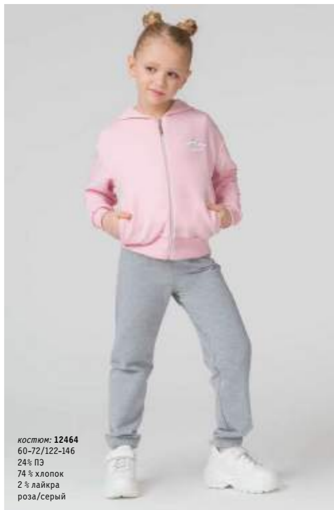
костюм: 12464 60-72/122-146 24% ПЭ 74% хлопок 2% лайкра роза/серый