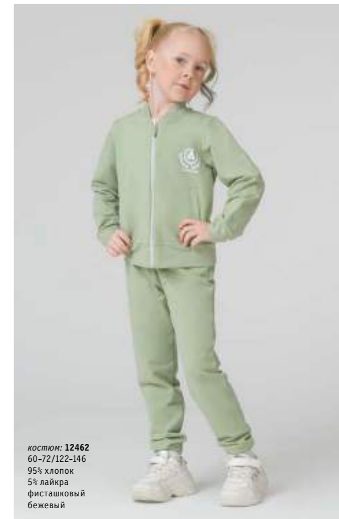
костюм: 12462 60-72/122-146 95% хлопок 5% лайкра фисташковый бежевый