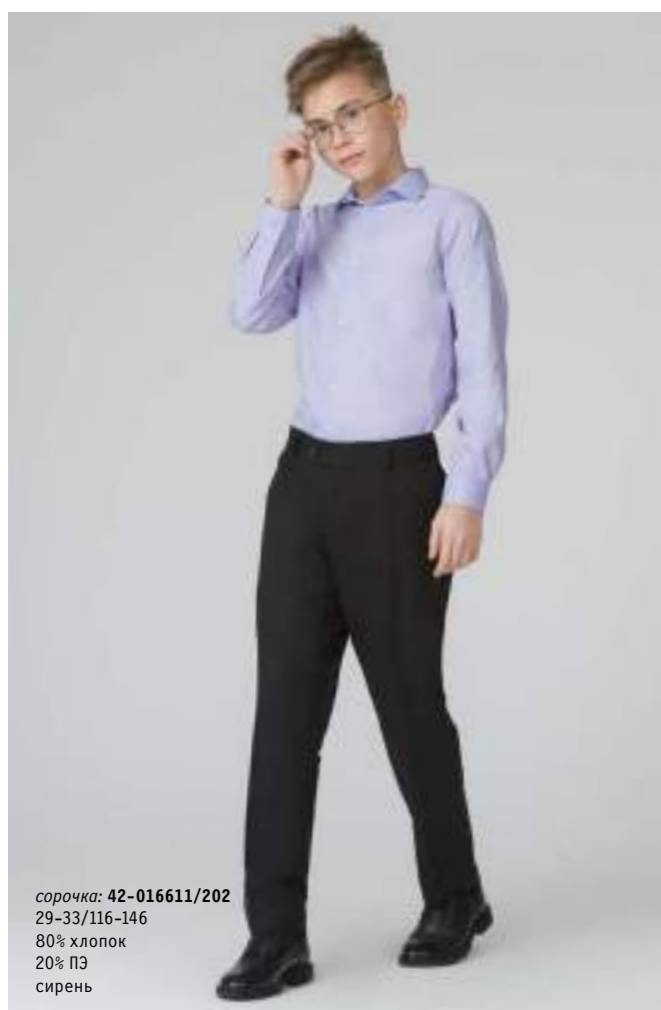
сорочка: 42-016611/202 29-33/116-146 80% хлопок 20% ПЭ сирень