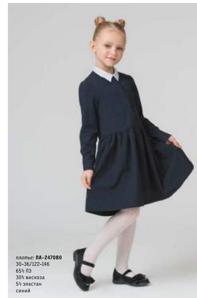
платье: ПА-247080 30-36/122-146 65% ПЭ 30% вискоза 5% эластан синий