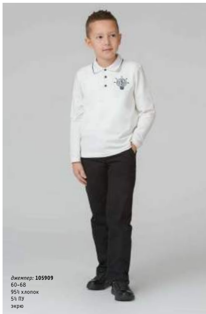
джерсер: 105909 60-68 95% хлопок 5% ПУ экрю