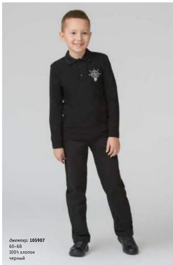
джерсер: 105907 60-68 100% хлопок черный