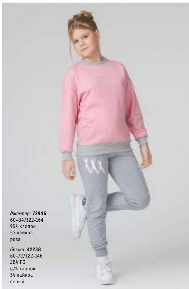
джерсер: 72946 60-84/122-164 95% хлопок 5% лайкра роза брюки: 42238 60-72/122-146 28% ПЭ 67% хлопок 5% лайкра серый