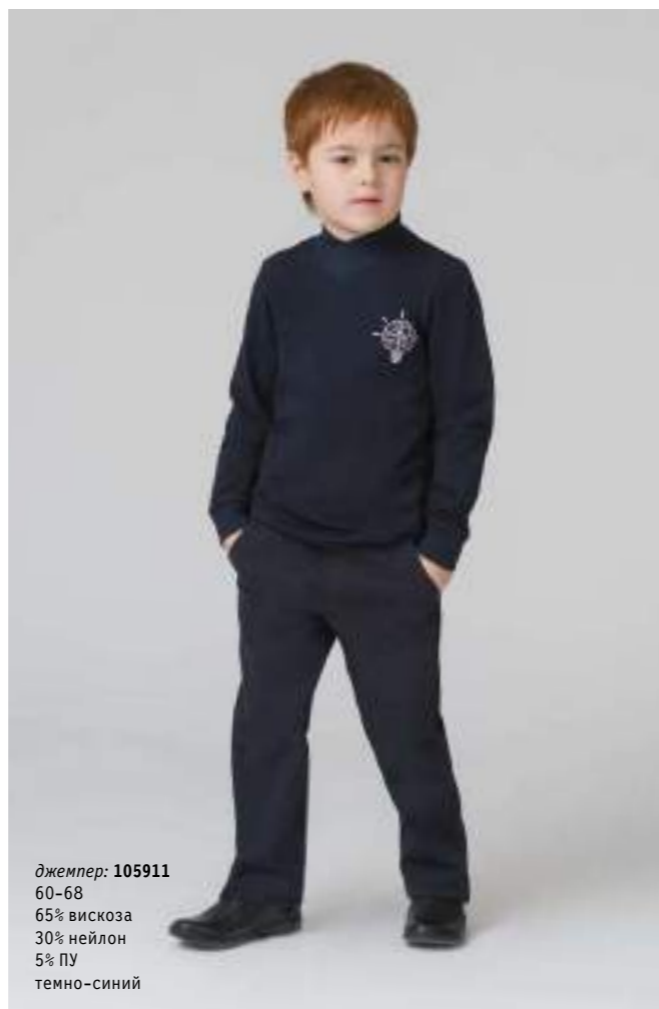
джерсер: 105911 60-68 65% вискоза 30% нейлон 5% ПУ темно-синий