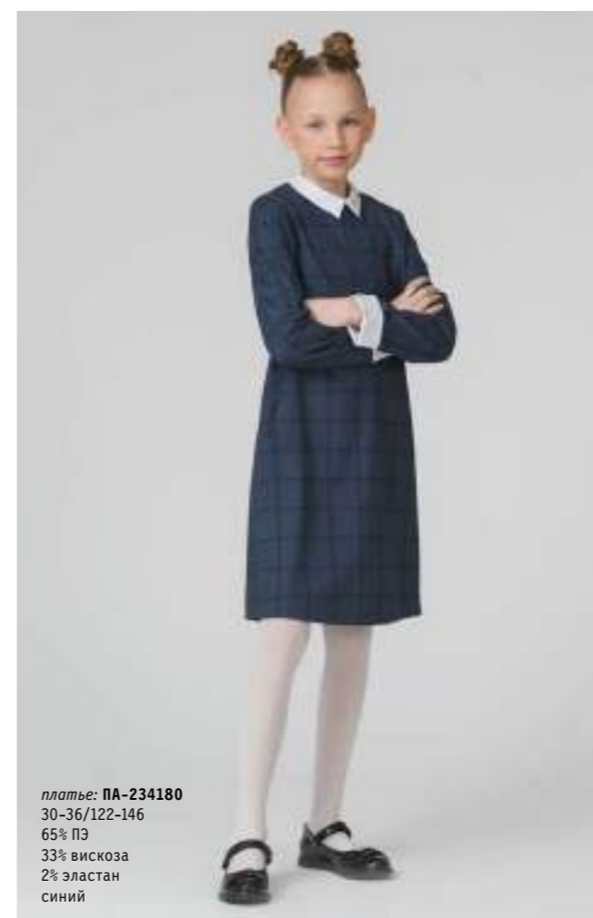
платье: ПА-234180 30-36/122-146 65% ПЭ 33% вискоза 2% эластан синий