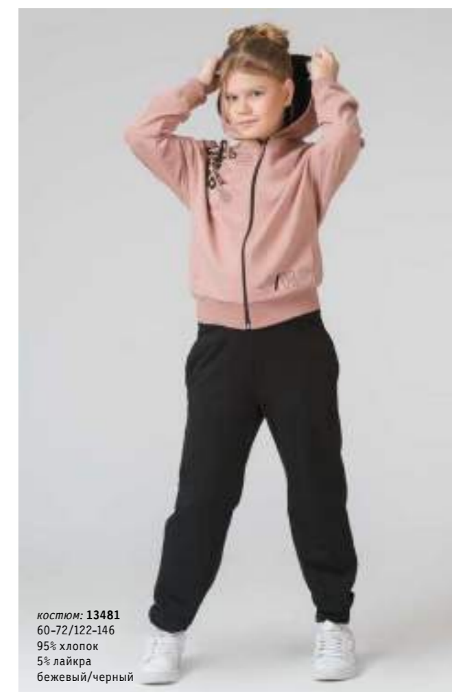
костюм: 13481 60-72/122-146 95% хлопок 5% лайкра бежевый/черный