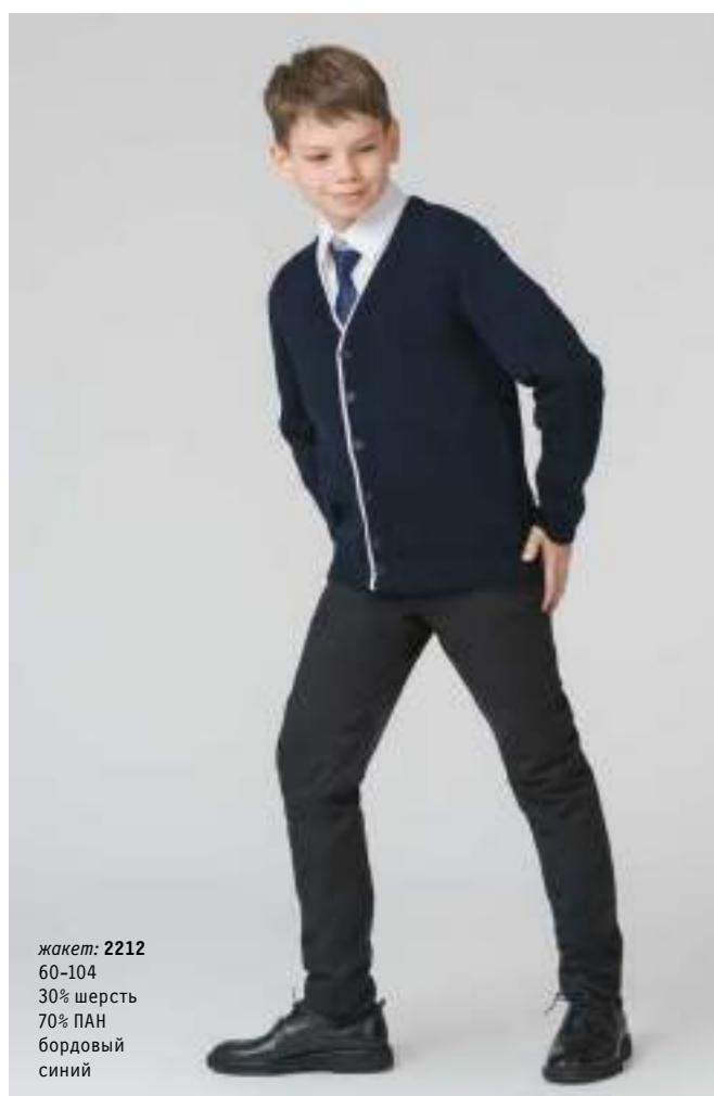
жакет: 2212 60-104 30% шерсть 70% ПАН бордовый синий