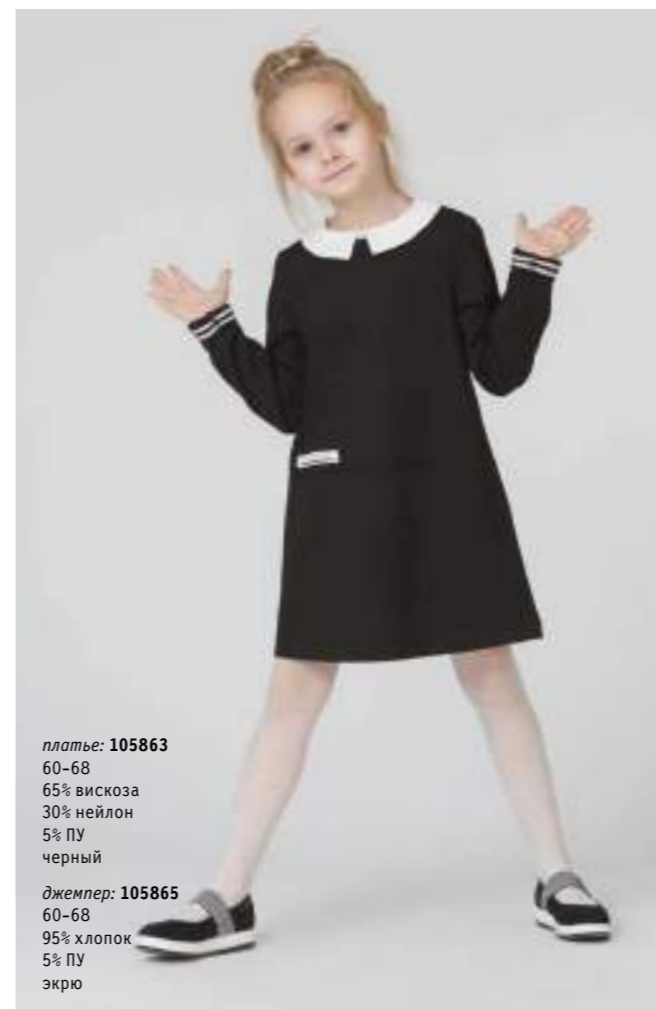
платье: 105863 60-68 65% вискоза 30% нейлон 5% ПУ черный джерсер: 105865 60-68 95% хлопок 5% ПУ экрю