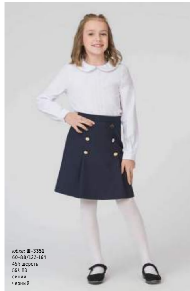
юбка: Ш-3351 60-88/122-164 45% шерсть 55% ПЭ синий черный