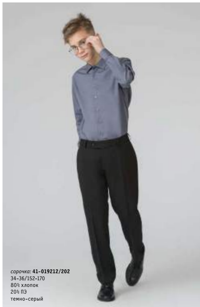
сорочка: 41-019212/202 34-36/152-170 80% хлопок 20% ПЭ темно-серый