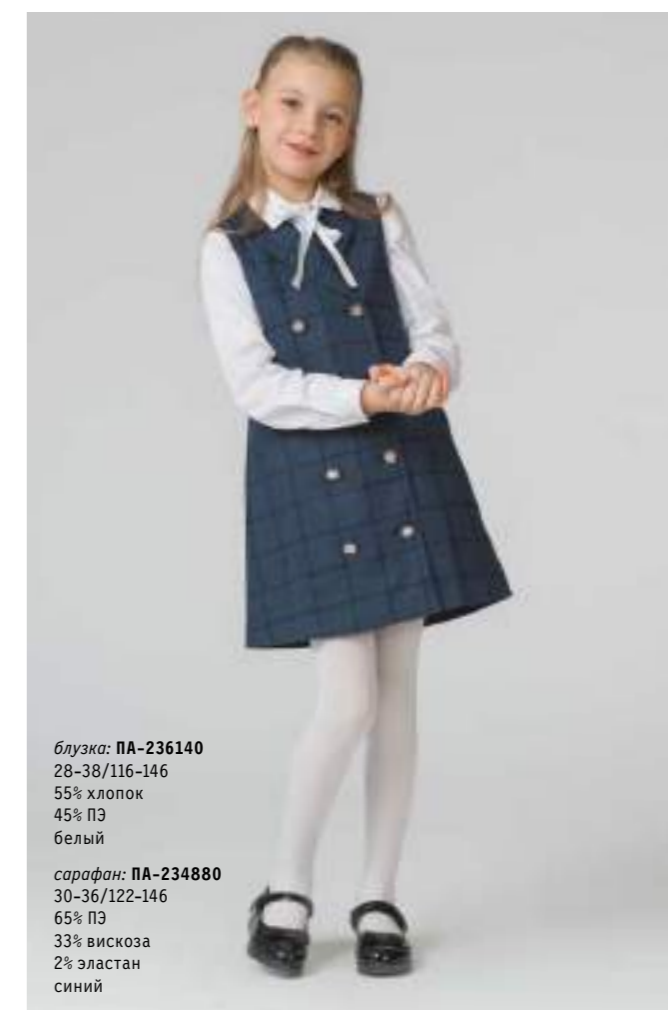
блузка: ПА-236140 28-38/116-146 55% хлопок 45% ПЭ белый сарафан: ПА-234880 30-36/122-146 65% ПЭ 33% вискоза 2% эластан синий