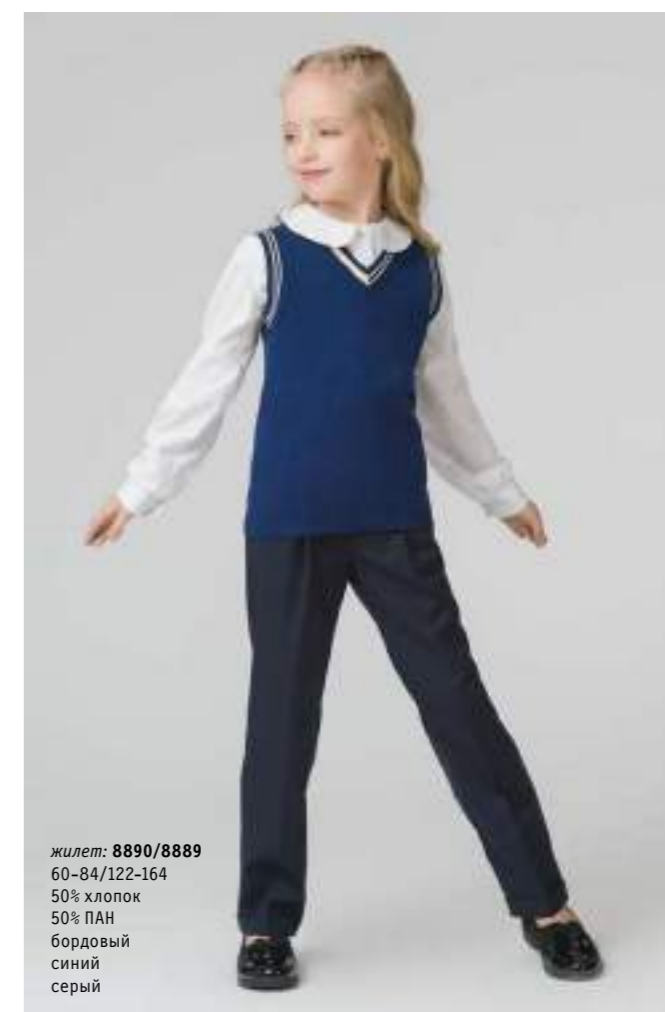
жилет: 8890/8889 60-84/122-164 50% хлопок 50% ПАН бордовый синий серый