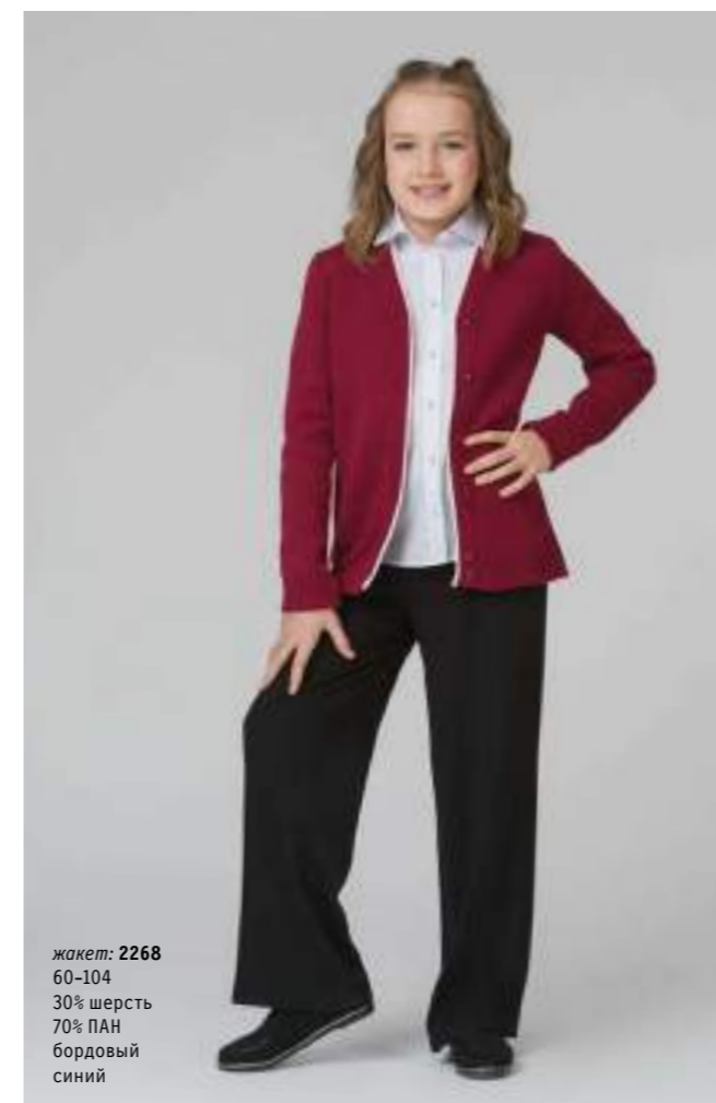
жакет: 2268 60-104 30% шерсть 70% ПАН бордовый синий

Коллекция состоит из изделий для девочек и мальчиков в классических расцветках. Правильный крой и эластичные ткани идеально подходят на любую комплекцию и помогают правильно расставлять акценты. Безупречное качество делает одежду удобной и практичной в ежедневной носке.