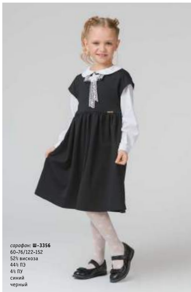
сарафан: Ш-3356 60-76/122-152 52% вискоза 44% ПЭ 4% ПУ синий черный