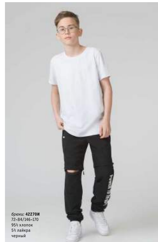
брюки: 42270И 72-84/146-170 95% хлопок 5% лайкра черный