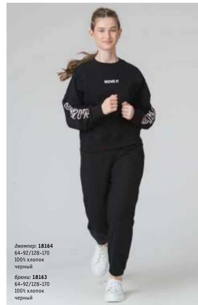
джерсер: 18164 64-92/128-170 100% хлопок черный брюки: 18163 64-92/128-170 100% хлопок черный