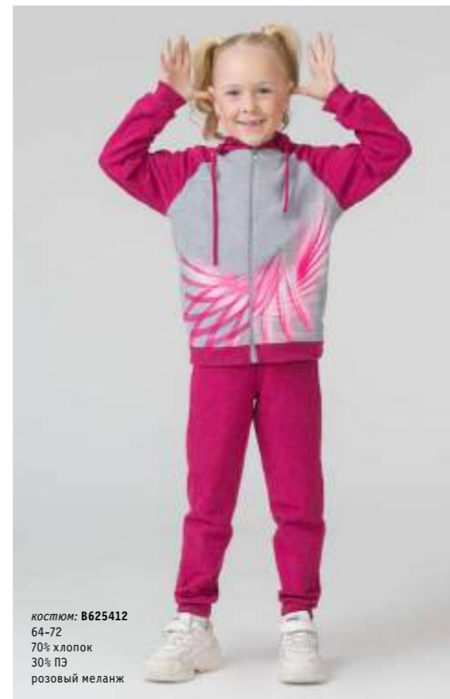
костюм: В625412 64-72 70% хлопок 30% ПЭ розовый меланж