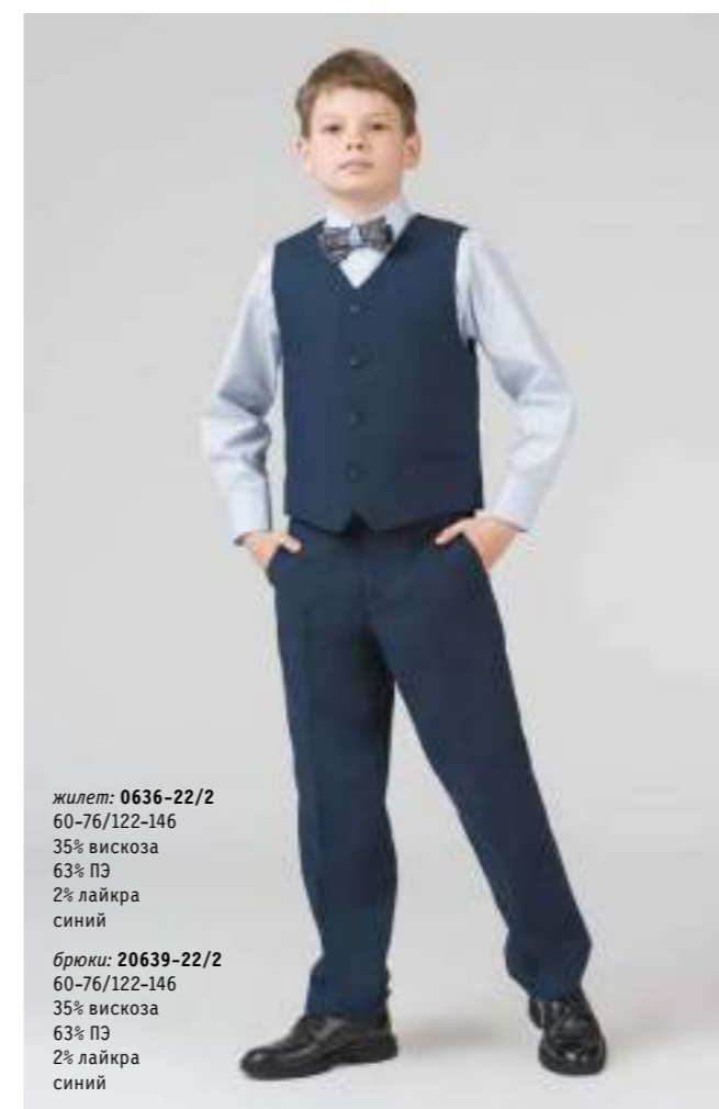
жилет: 0636-22/2 60-76/122-146 35% вискоза 63% ПЭ 2% лайкра синий