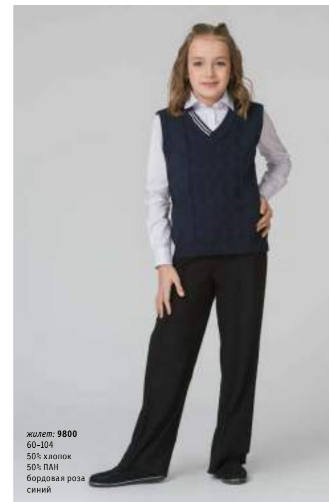
жилет: 9800 60-104 50% хлопок 50% ПАН бордовая роза синий