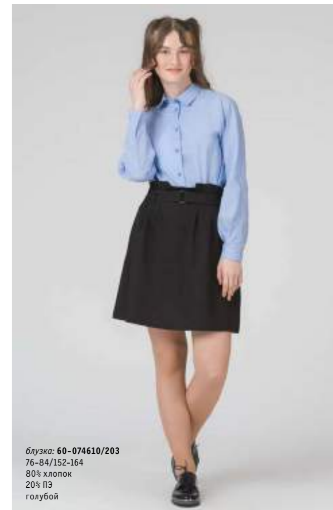
блузка: 60-074610/203 76-84/152-164 80% хлопок 20% ПЭ голубой