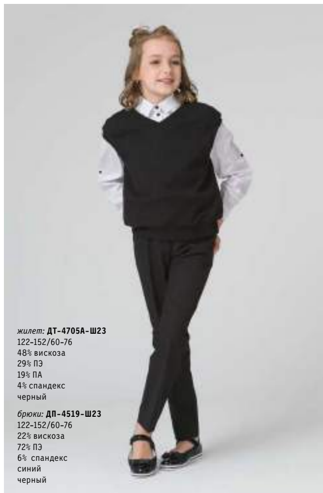
жилет: ДТ-4705А-Ш23 122-152/60-76 48% вискоза 29% ПЭ 19% ПА 4% спандекс черный