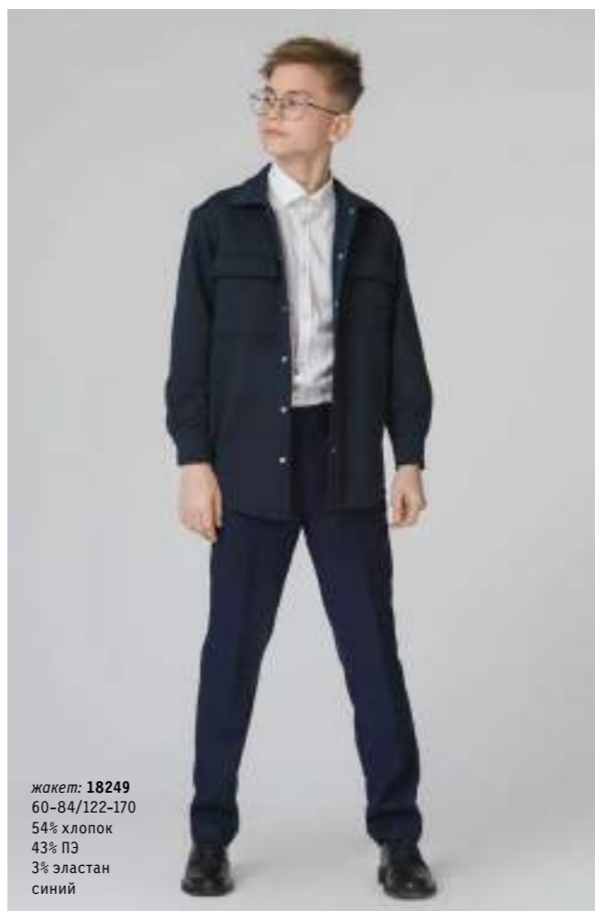
жакет: 18249 60-84/122-170 54% хлопок 43% ПЭ 3% эластан синий

Школьная коллекция ОАО «8 Марта» разработана для стильных и гармоничных учеников. Отличается современным дизайном, комфортом, сочетанием в одежде урбанистической культуры, «взрослой деловой» классики и элементов подростковой непосредственности. Коллекция включает как деловую одежду для школы "School", так и спортивную «Физ-ра».