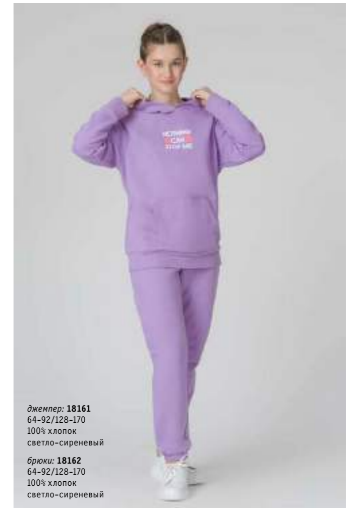
джерсер: 18161 64-92/128-170 100% хлопок светло-сиреневый брюки: 18162 64-92/128-170 100% хлопок светло-сиреневый