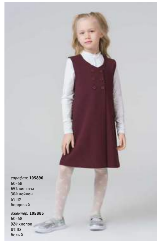
сарфан: 105890 60-68 65% вискоза 30% нейлон 5% ПУ бордовый джерсер: 105885 60-68 92% хлопок 8% ПУ белый