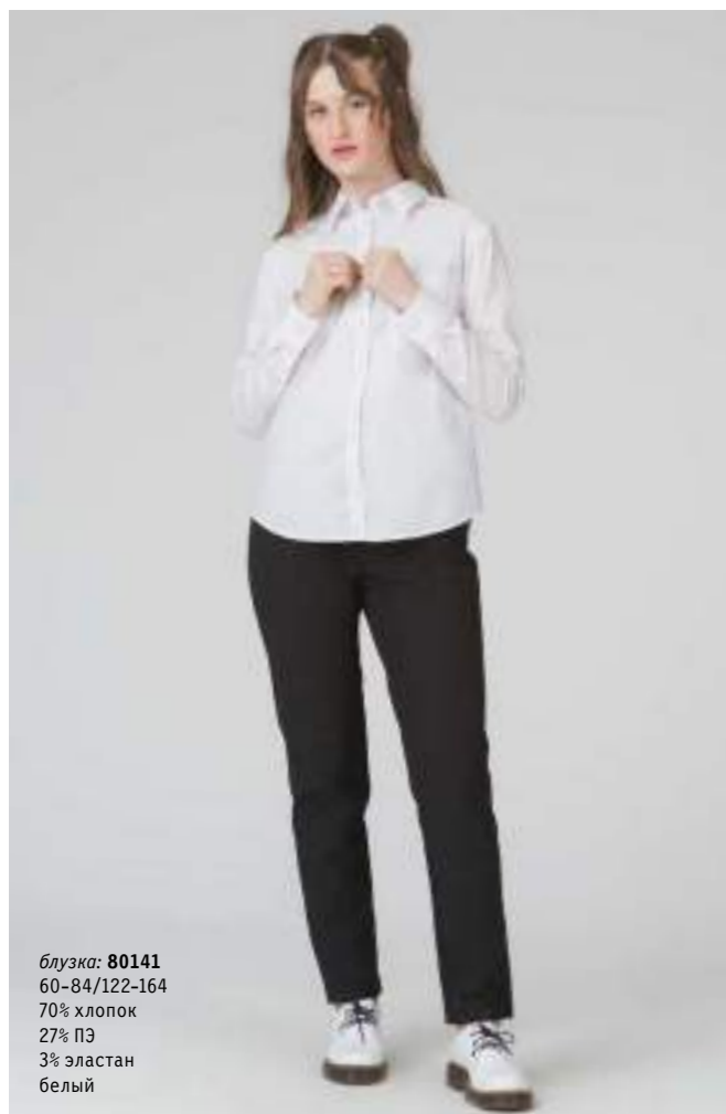
блузка: 80141 60-84/122-164 70% хлопок 27% ПЭ 3% эластан белый

Одежда SILVER GREY – это не просто одежда, а способ поиска своей индивидуальности и самовыражения.