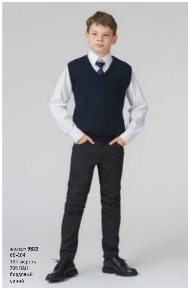
жилет: 9822 60-104 30% шерсть 70% ПАН бордовый синий