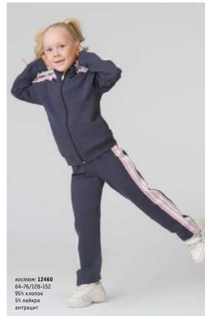
костюм: 12460 64-76/128-152 95% хлопок 5% лайкра антрацит