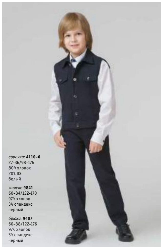
сорочка: 4110-6 27-36/98-176 80% хлопок 20% ПЭ белый