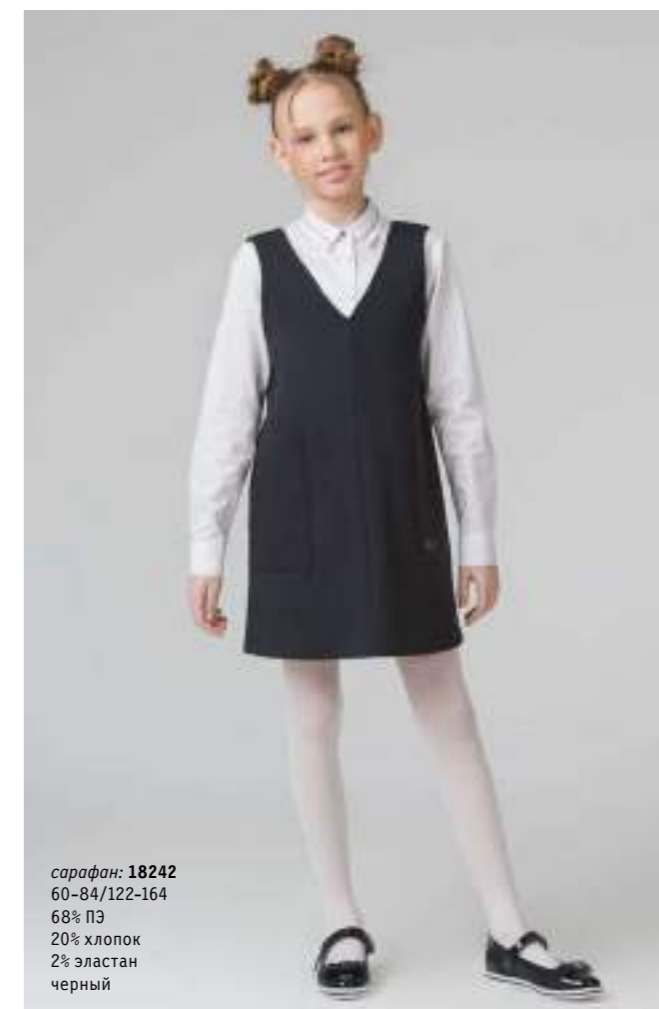
сарафан: 18242 60-84/122-164 68% ПЭ 20% хлопок 2% эластан черный