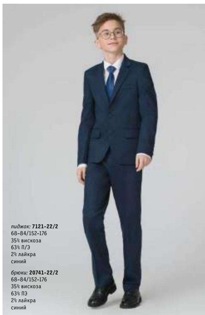
пиджак: 7121-22/2 68-84/152-176 35% вискоза 63% ПЭ 2% лайкра синий