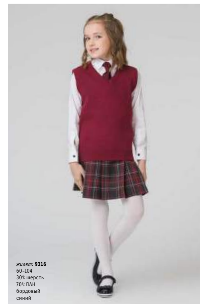
жилет: 9316 60-104 30% шерсть 70% ПАН бордовый синий