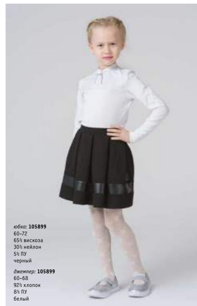
юбка: 105899 60-72 65% вискоза 30% нейлон 5% ПУ черный джемпер: 105899 60-68 92% хлопок 8% ПУ белый