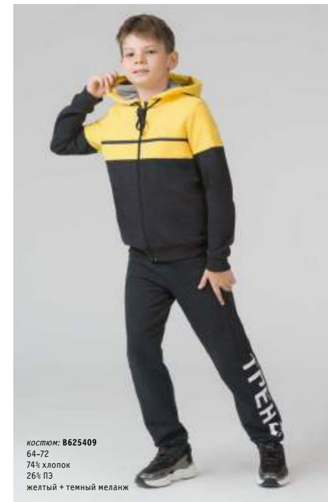
костюм: В625409 64-72 74% хлопок 26% ПЭ желтый + темный меланж