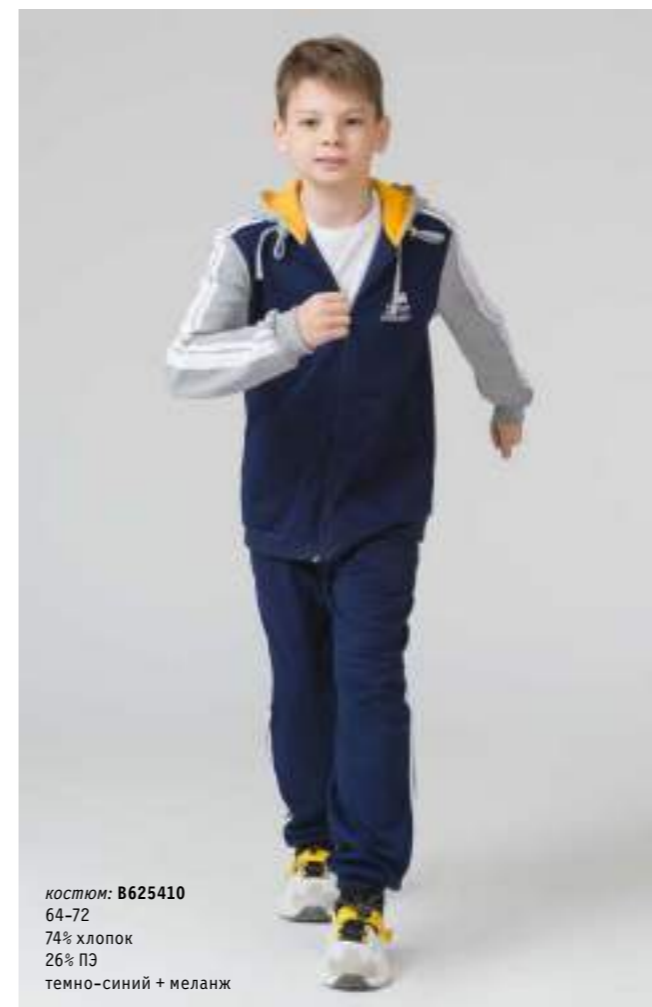
костюм: В625410 64-72 74% хлопок 26% ПЭ темно-синий + меланж