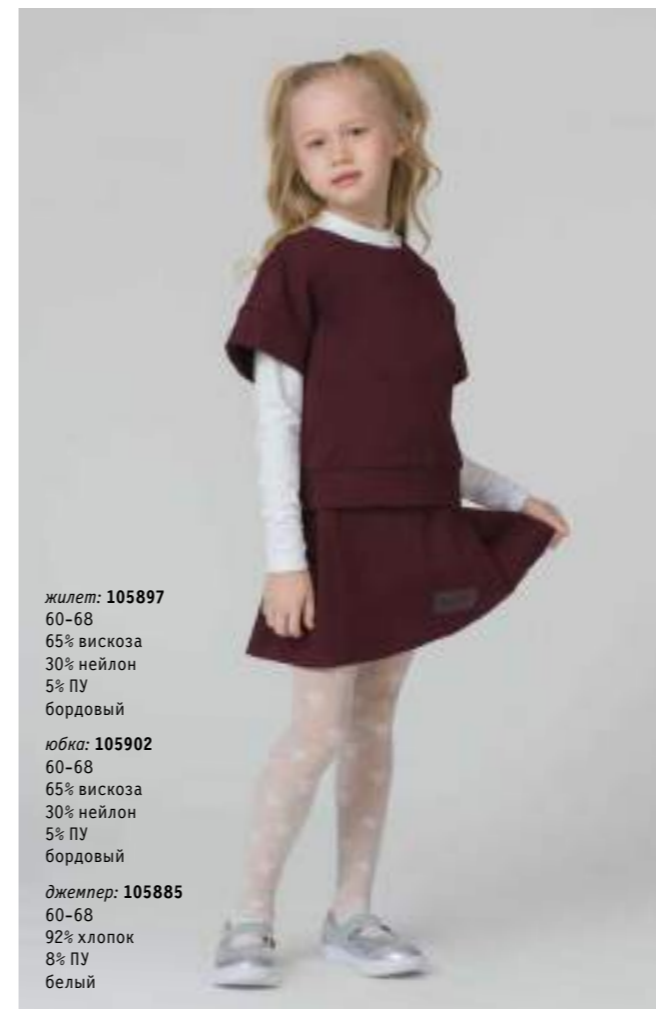
жилет: 105897 60-68 65% вискоза 30% нейлон 5% ПУ бордовый юбка: 105902 60-68 65% вискоза 30% нейлон 5% ПУ бордовый джерсер: 105885 60-68 92% хлопок 8% ПУ белый