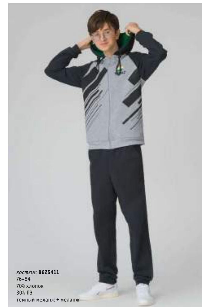
костюм: В625411 76-84 70% хлопок 30% ПЭ темный меланж + меланж