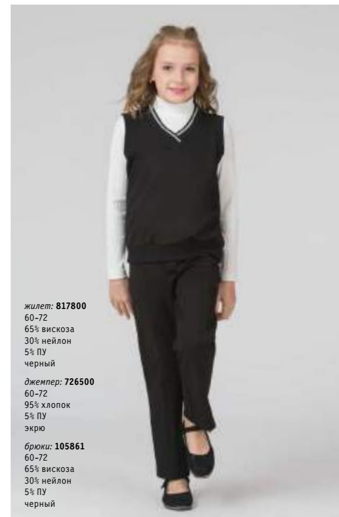
жилет: 817800 60-72 65% вискоза 30% нейлон 5% ПУ черный джерсер: 726500 60-72 95% хлопок 5% ПУ экрю брюки: 105861 60-72 65% вискоза 30% нейлон 5% ПУ черный