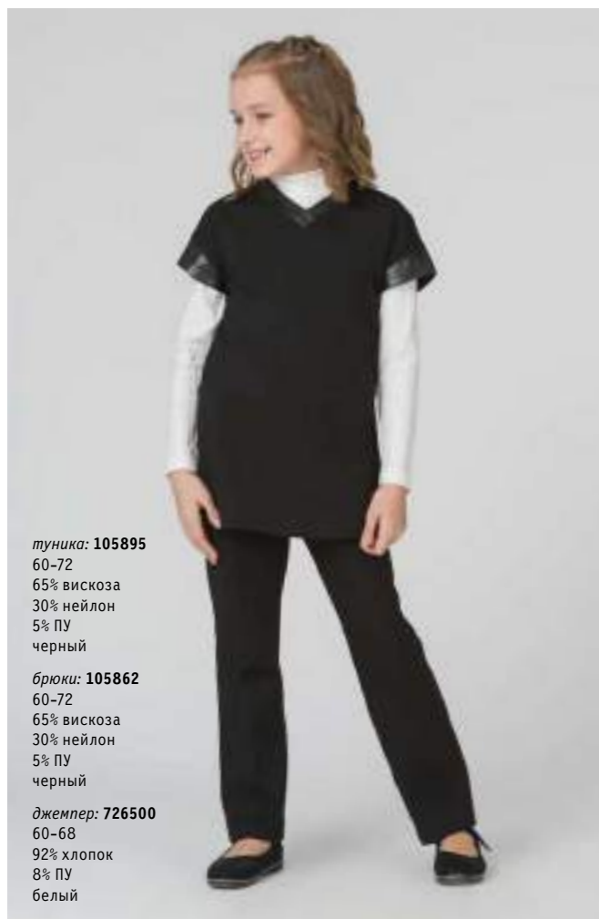
туника: 105895 60-72 65% вискоза 30% нейлон 5% ПУ черный брюки: 105862 60-72 65% вискоза 30% нейлон 5% ПУ черный джерсер: 726500 60-68 92% хлопок 8% ПУ белый