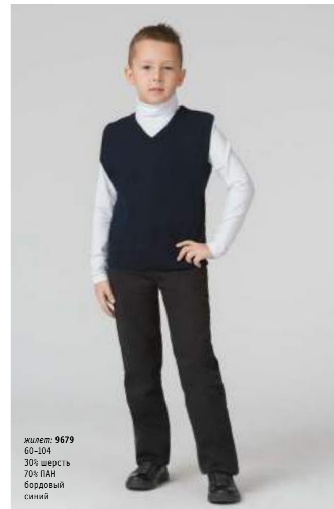
жилет: 9679 60-104 30% шерсть 70% ПАН бордовый синий