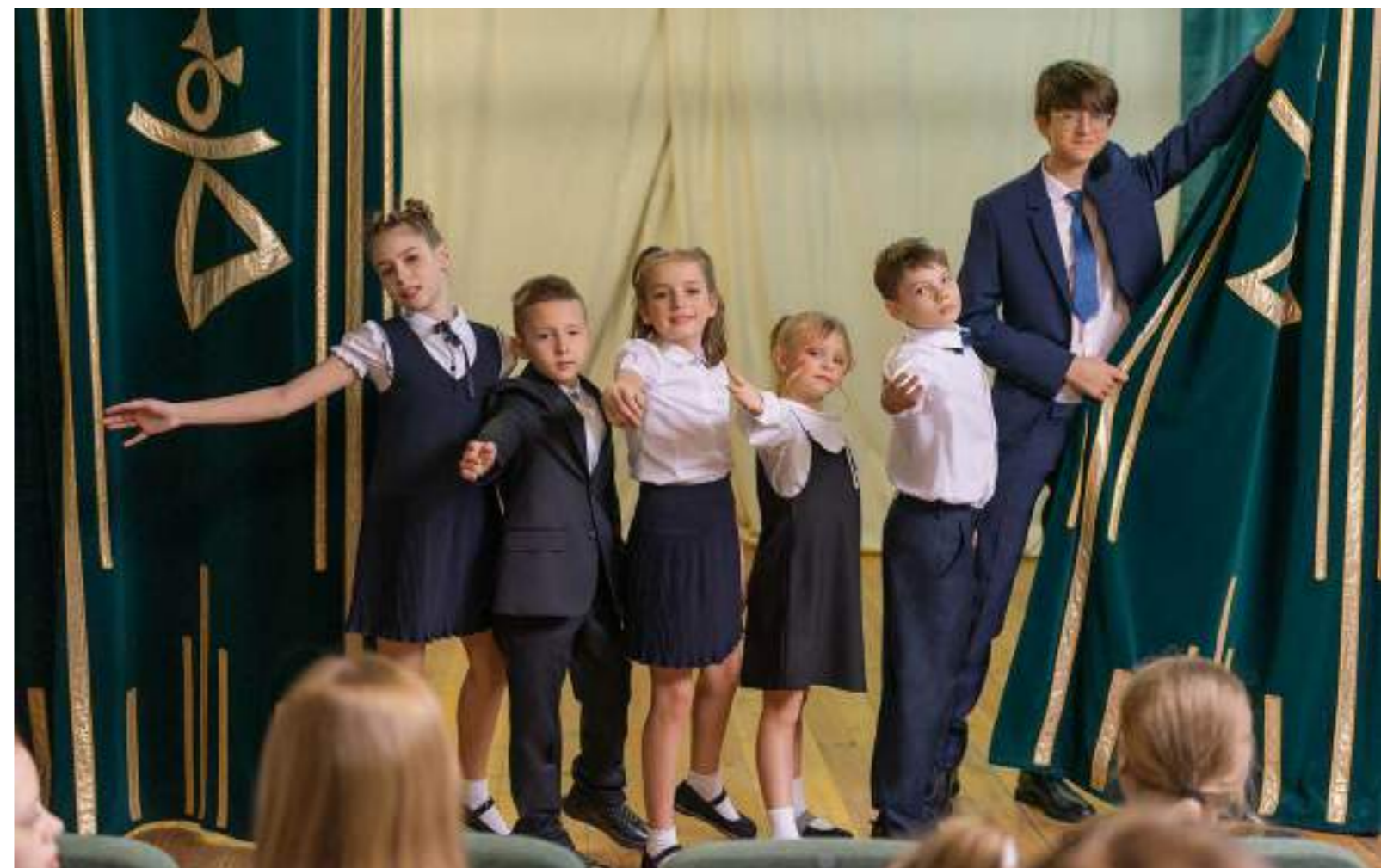
галстук: 7555 76-84 100% ПЭ темно-синий