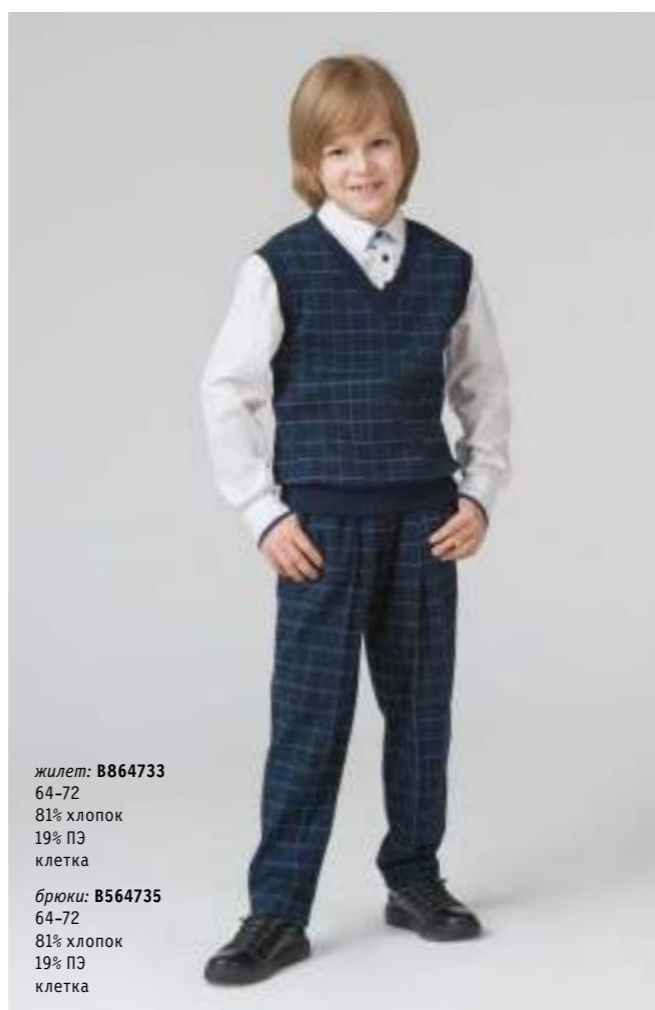
жилет: B864733 64-72 81% хлопок 19% ПЭ клетка

Одежда ОАО «СВІТАНАК» сочетает в себе современность, модный дизайн и высокое качество изделий по доступным ценам. Универсальность наших коллекций позволяет легко и просто комбинировать модели друг с другом и всегда выглядеть стильно и уверенно.