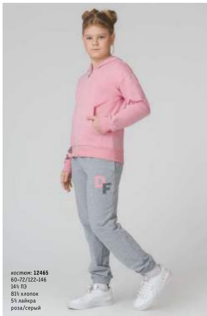
костюм: 12465 60-72/122-146 14% ПЭ 81% хлопок 5% лайкра роза/серый