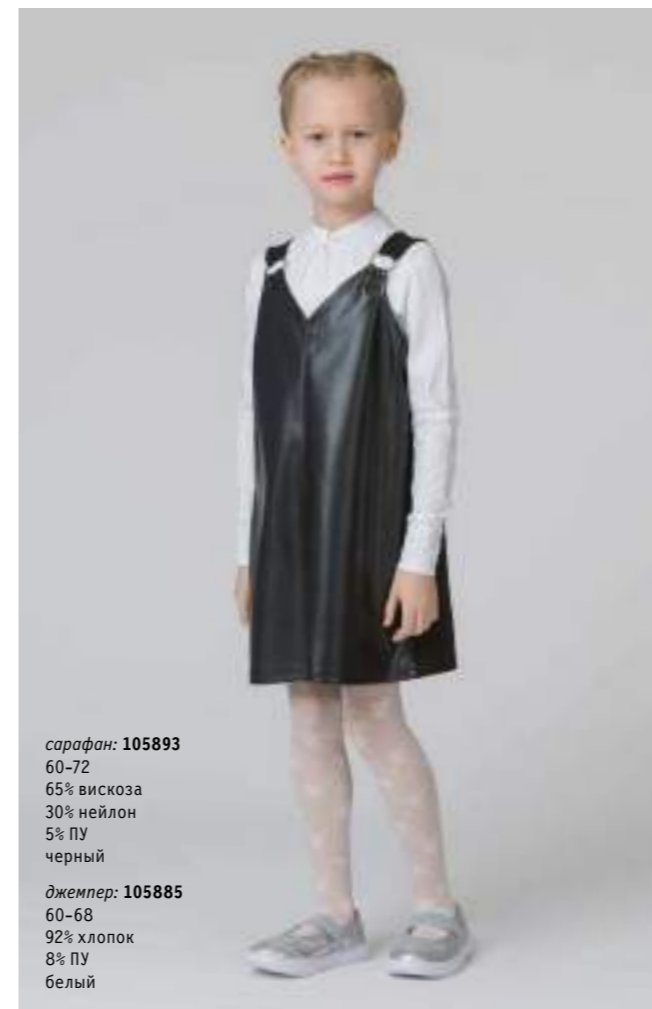
сарафан: 105893 60-72 65% вискоза 30% нейлон 5% ПУ черный джемпер: 105885 60-68 92% хлопок 8% ПУ белый

В школьной коллекции ОАО «КУПАЛИНКА» представлены джемпера в сочетании с сарафанами, жилетами, брюками, юбками, а также платьями базового кроя из трикотажных полотен. Модели имеют максимально простой и лаконичный дизайн: выполнены в строгой гамме, имеют прямой силуэт. Трикотажные джемпера – отличный вариант на каждый день. Каждый из них одинаково хорошо сочетается как с классическими моделями, так и с выполненными в спортивном стиле.