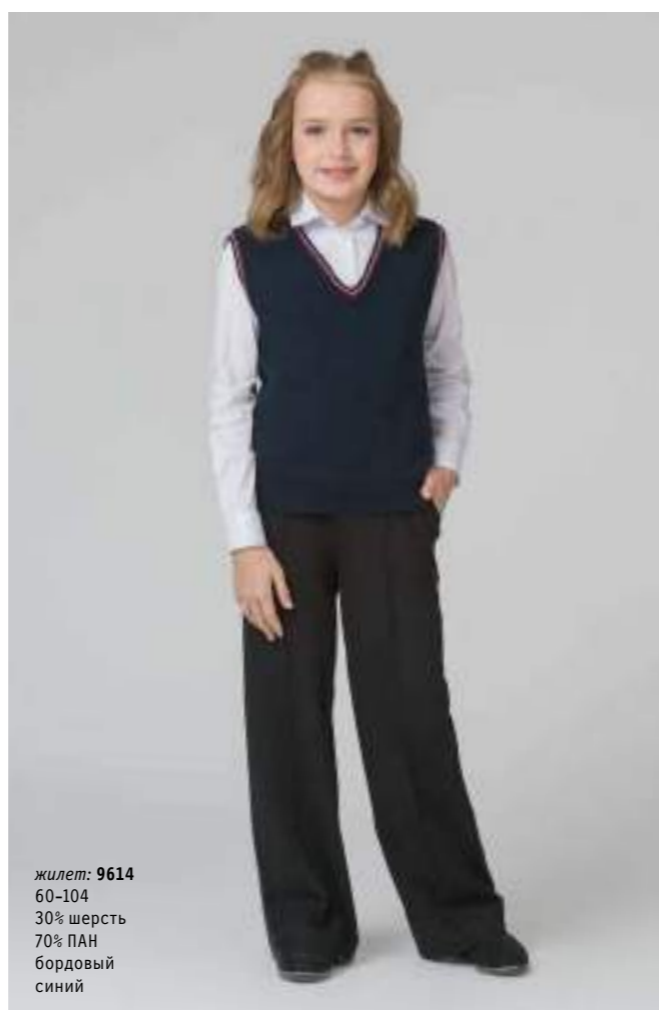
жилет: 9614 60-104 30% шерсть 70% ПАН бордовый синий