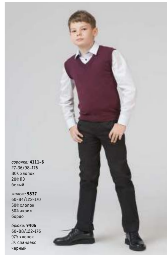
сорочка: 4111-6 27-36/98-176 80% хлопок 20% ПЭ белый