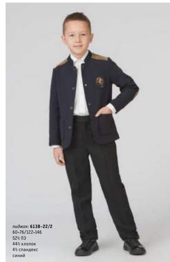
пиджак: 6138-22/2 60-76/122-146 52% ПЭ 44% хлопок 4% спандекс синий