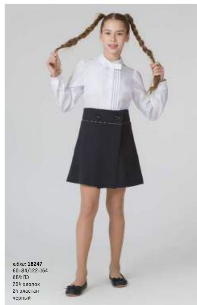
юбка: 18247 60-84/122-164 68% ПЭ 20% хлопок 2% эластан черный