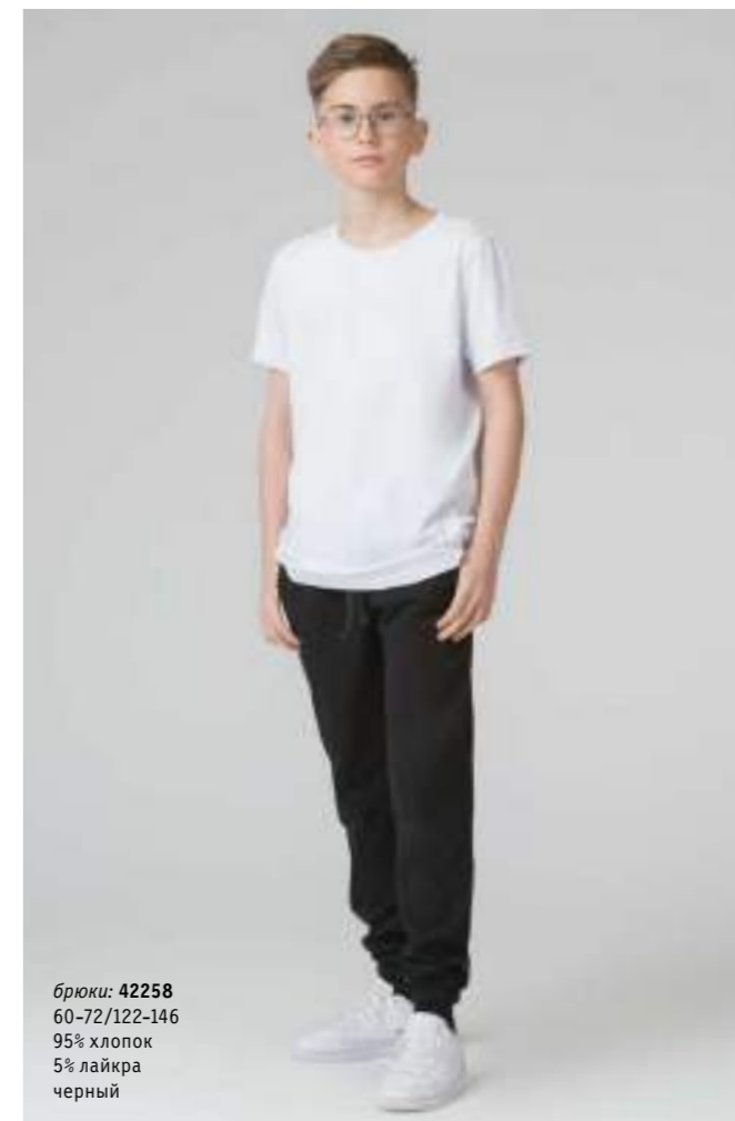
брюки: 42258 60-72/122-146 95% хлопок 5% лайкра черный