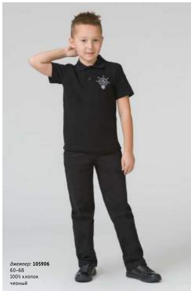
джерсер: 105906 60-68 100% хлопок черный