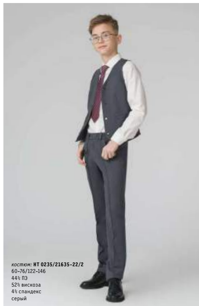
костюм: НТ 0235/21635-22/2 60-76/122-146 44% ПЭ 52% вискоза 4% спандекс серый