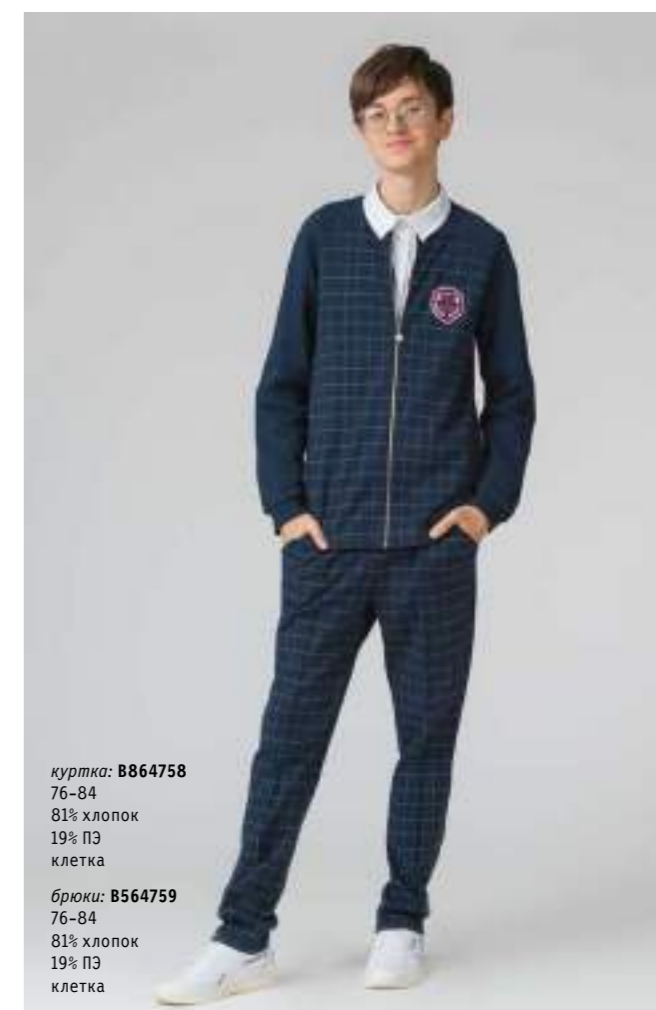
куртка: B864758 76-84 81% хлопок 19% ПЭ клетка