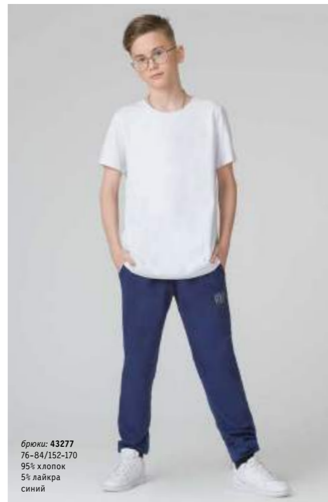
брюки: 43277 76-84/152-170 95% хлопок 5% лайкра синий