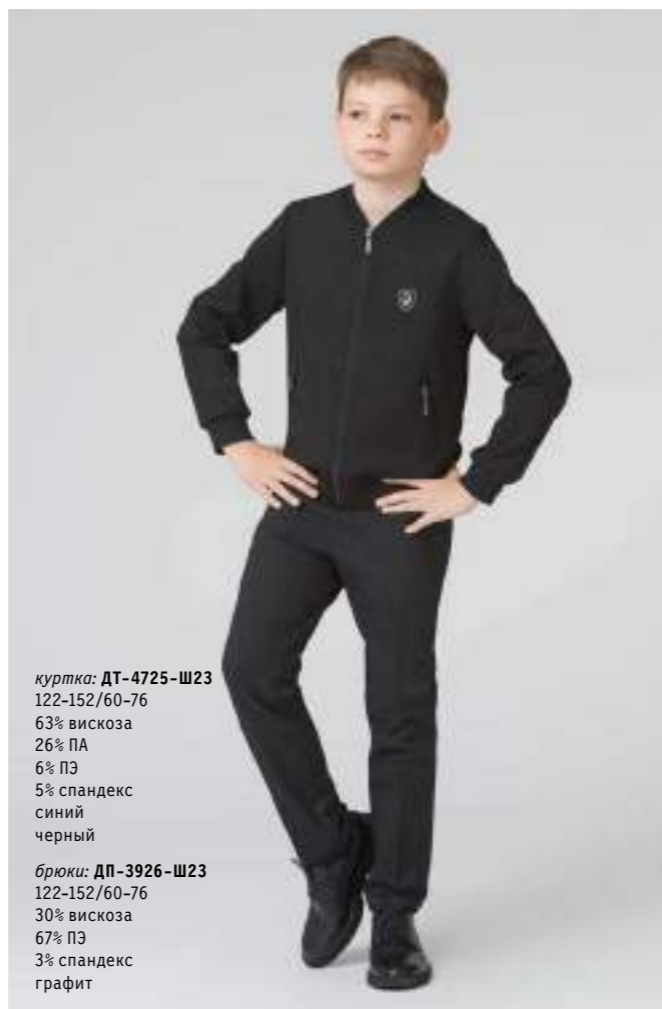
куртка: ДТ-4725-Ш23 122-152/60-76 63% вискоза 26% ПА 6% ПЭ 5% спандекс синий черный