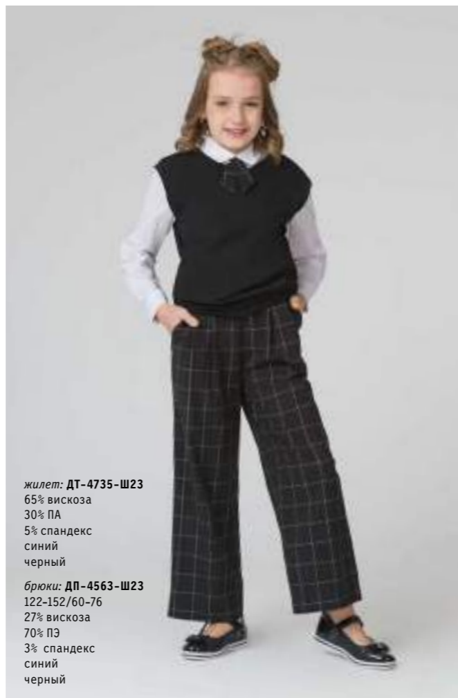
жилет: ДТ-4735-Ш23 65% вискоза 30% ПА 5% спандекс синий черный