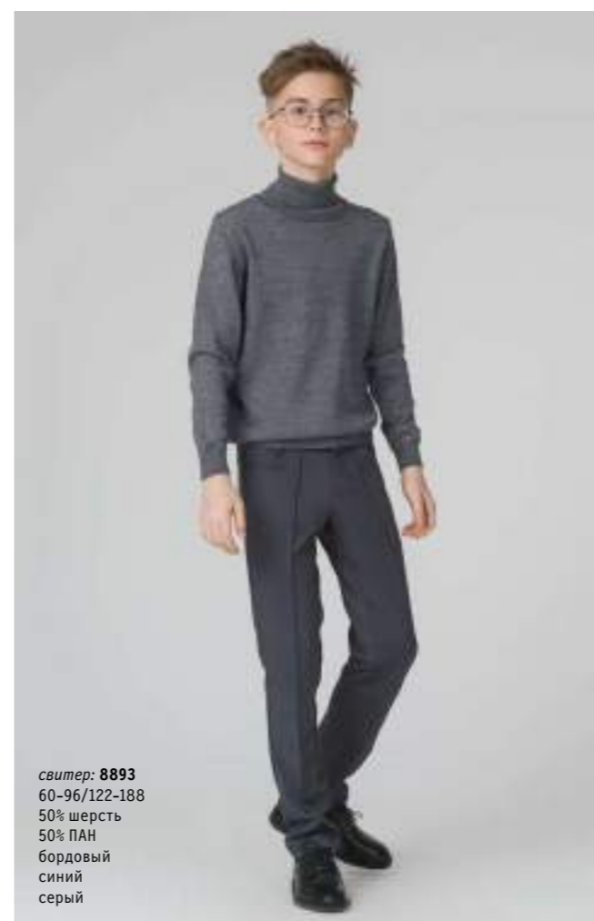
свитер: 8893 60-96/122-188 50% шерсть 50% ПАН бордовый синий серый