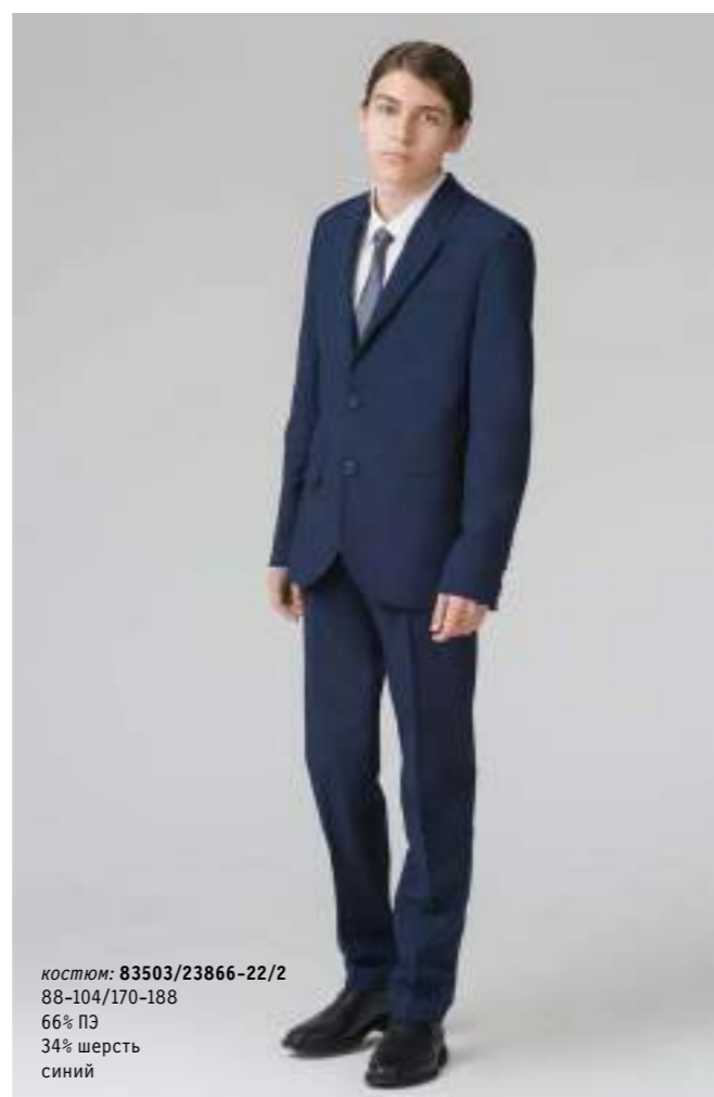
костюм: 83503/23866-22/2 88-104/170-188 66% ПЭ 34% шерсть синий