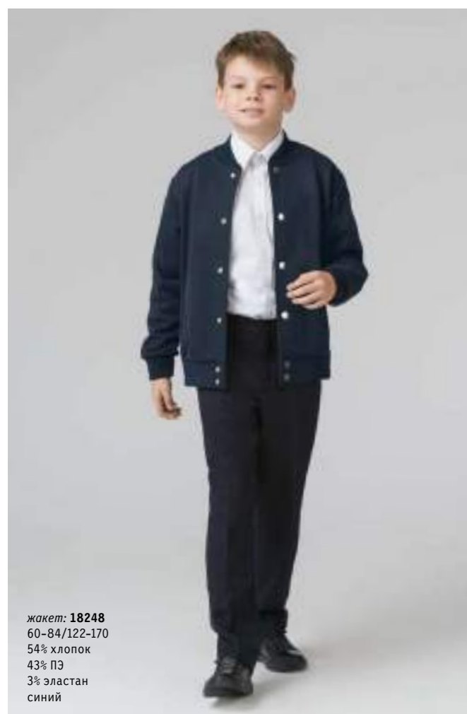
жакет: 18248 60-84/122-170 54% хлопок 43% ПЭ 3% эластан синий