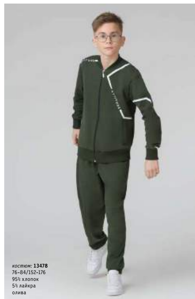
костюм: 13478 76-84/152-176 95% хлопок 5% лайкра олива

«ТОК» – энергия, импульс, движение, заряд.