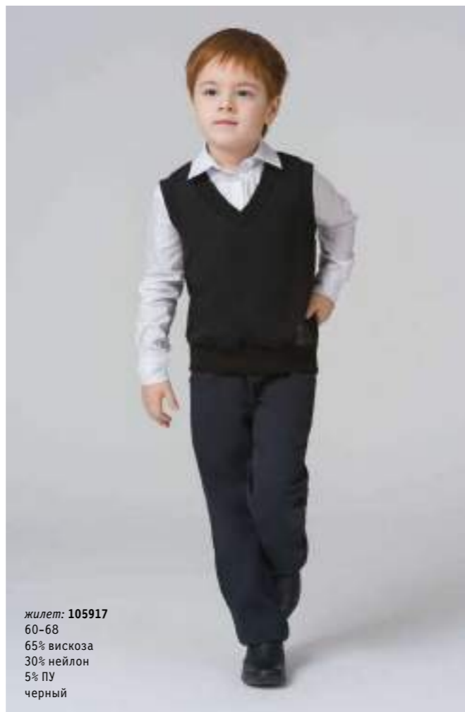
жилет: 105917 60-68 65% вискоза 30% нейлон 5% ПУ черный