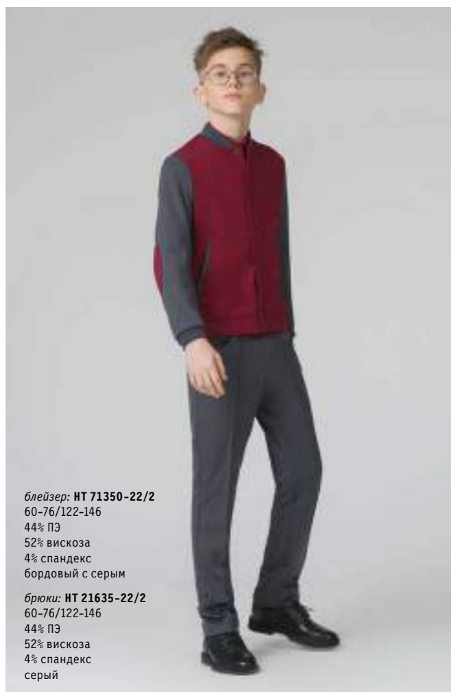
блейзер: НТ 71350-22/2 60-76/122-146 44% ПЭ 52% вискоза 4% спандекс бордовый с серым