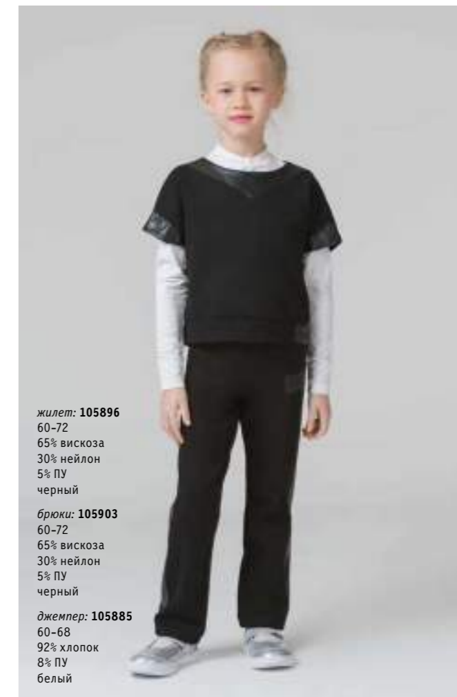
жилет: 105896 60-72 65% вискоза 30% нейлон 5% ПУ черный брюки: 105903 60-72 65% вискоза 30% нейлон 5% ПУ черный джемпер: 105885 60-68 92% хлопок 8% ПУ белый