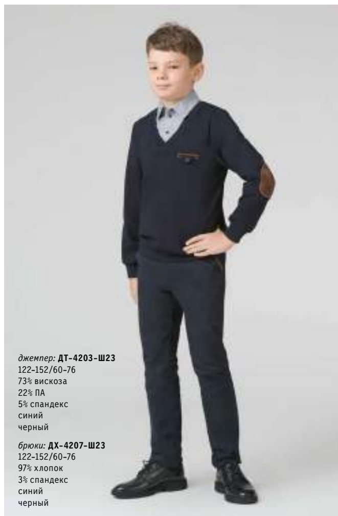
джерсер: ДТ-4203-Ш23 122-152/60-76 73% вискоза 22% ПА 5% спандекс синий черный