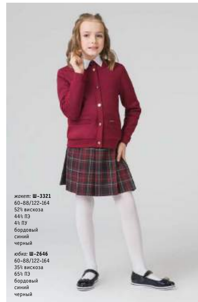
жакет: Ш-3321 60-88/122-164 52% вискоза 44% ПЭ 4% ПУ бордовый синий черный юбка: Ш-2646 60-88/122-164 35% вискоза 65% ПЭ бордовый синий черный