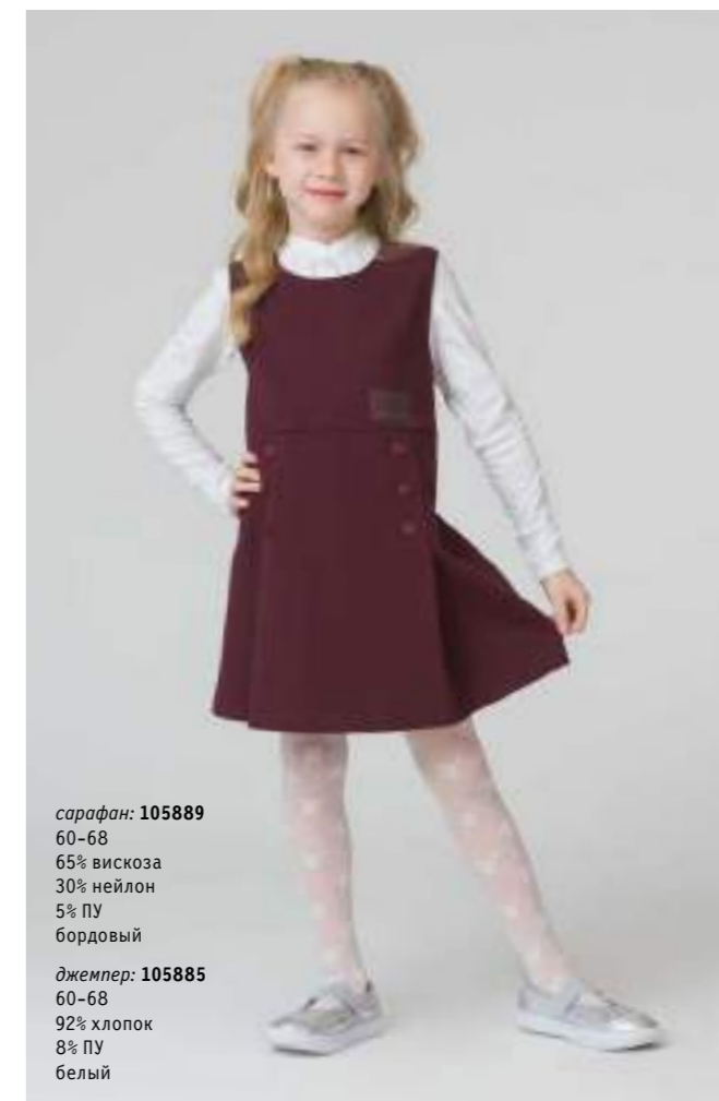
сарфан: 105889 60-68 65% вискоза 30% нейлон 5% ПУ бордовый джерсер: 105885 60-68 92% хлопок 8% ПУ белый