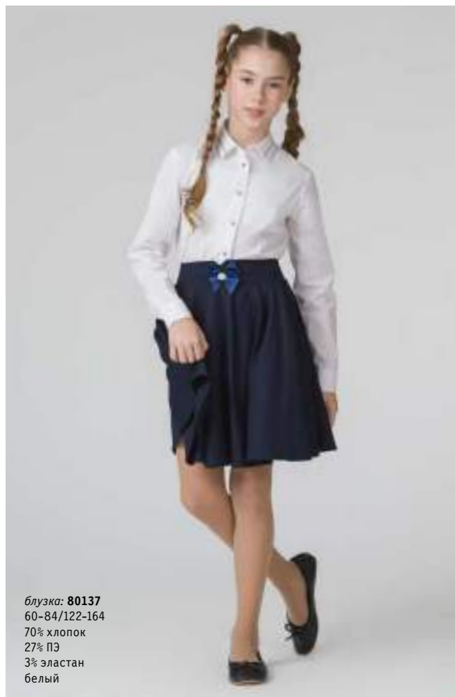
блузка: 80137 60-84/122-164 70% хлопок 27% ПЭ 3% эластан белый