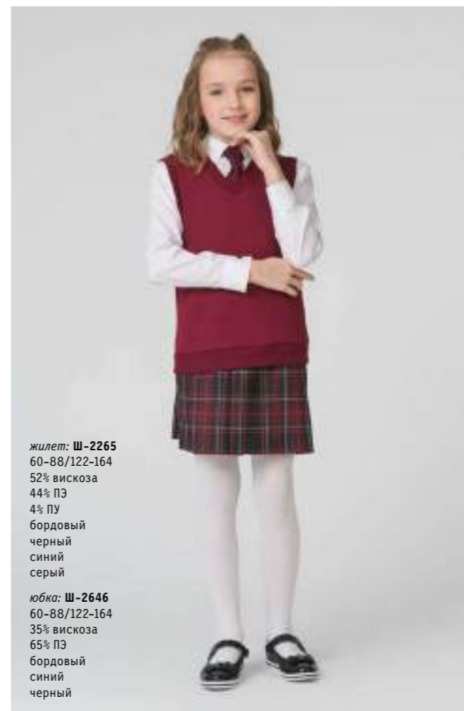
жилет: Ш-2265 60-88/122-164 52% вискоза 44% ПЭ 4% ПУ бордовый черный синий серый юбка: Ш-2646 60-88/122-164 35% вискоза 65% ПЭ бордовый синий черный