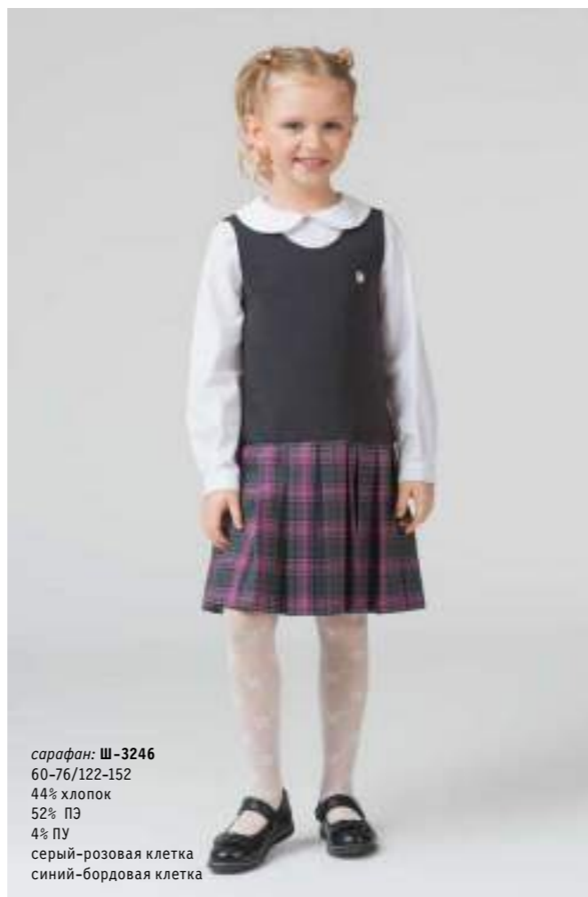
сарафан: Ш-3246 60-76/122-152 44% хлопок 52% ПЭ 4% ПУ серый-розовая клетка синий-бордовая клетка