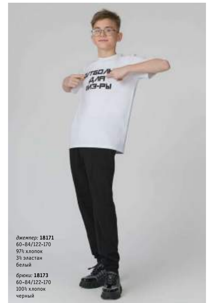
джерсер: 18171 60-84/122-170 97% хлопок 3% эластан белый брюки: 18173 60-84/122-170 100% хлопок черный