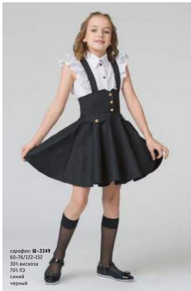
сарафан: Ш-3349 60-76/122-152 30% вискоза 70% ПЭ синий черный