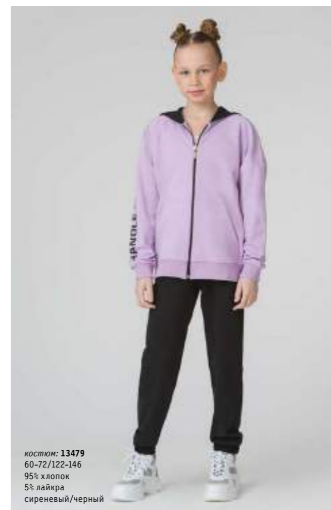
костюм: 13479 60-72/122-146 95% хлопок 5% лайкра сиреневый/черный