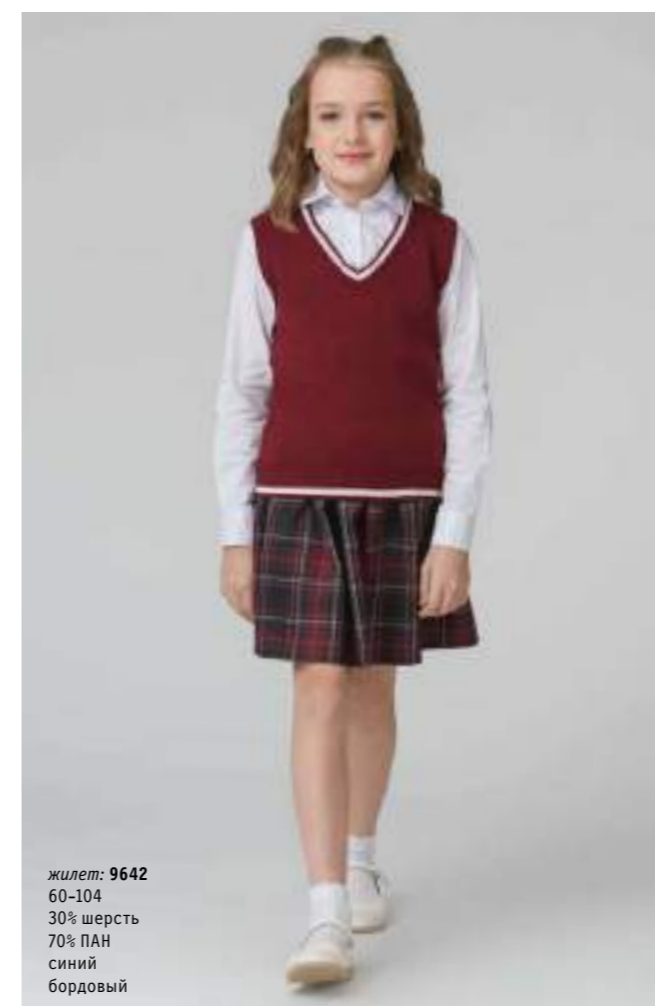
жилет: 9642 60-104 30% шерсть 70% ПАН синий бордовый