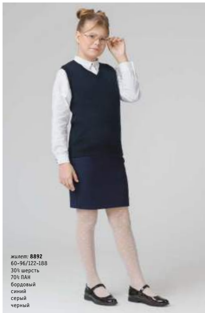
жилет: 8892 60-96/122-188 30% шерсть 70% ПАН бордовый синий серый черный

Качество продукции ОАО «Алеся» отвечает самым высоким Европейским критериям.