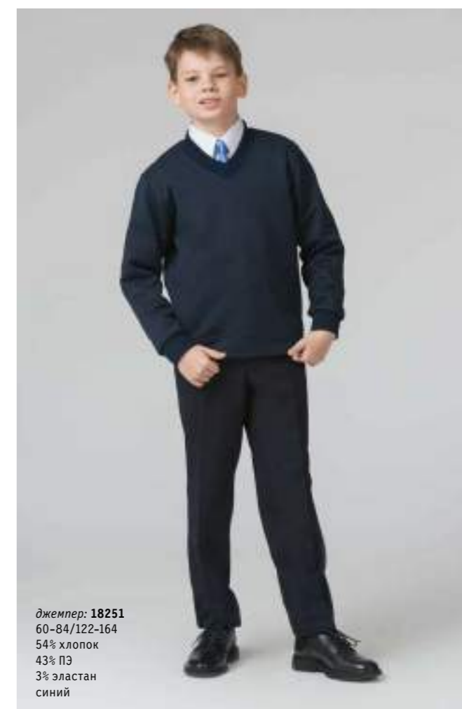
джерсер: 18251 60-84/122-164 54% хлопок 43% ПЭ 3% эластан синий