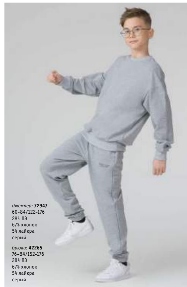
джерсер: 72947 60-84/122-176 28% ПЭ 67% хлопок 5% лайкра серый брюки: 42265 76-84/152-176 28% ПЭ 67% хлопок 5% лайкра серый