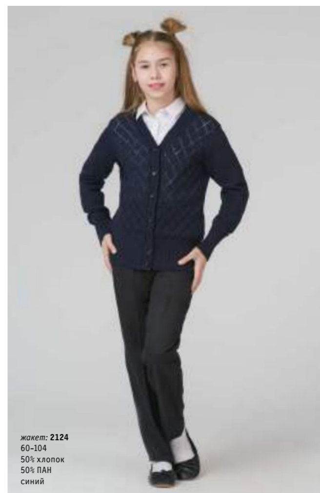
жакет: 2124 60-104 50% хлопок 50% ПАН синий