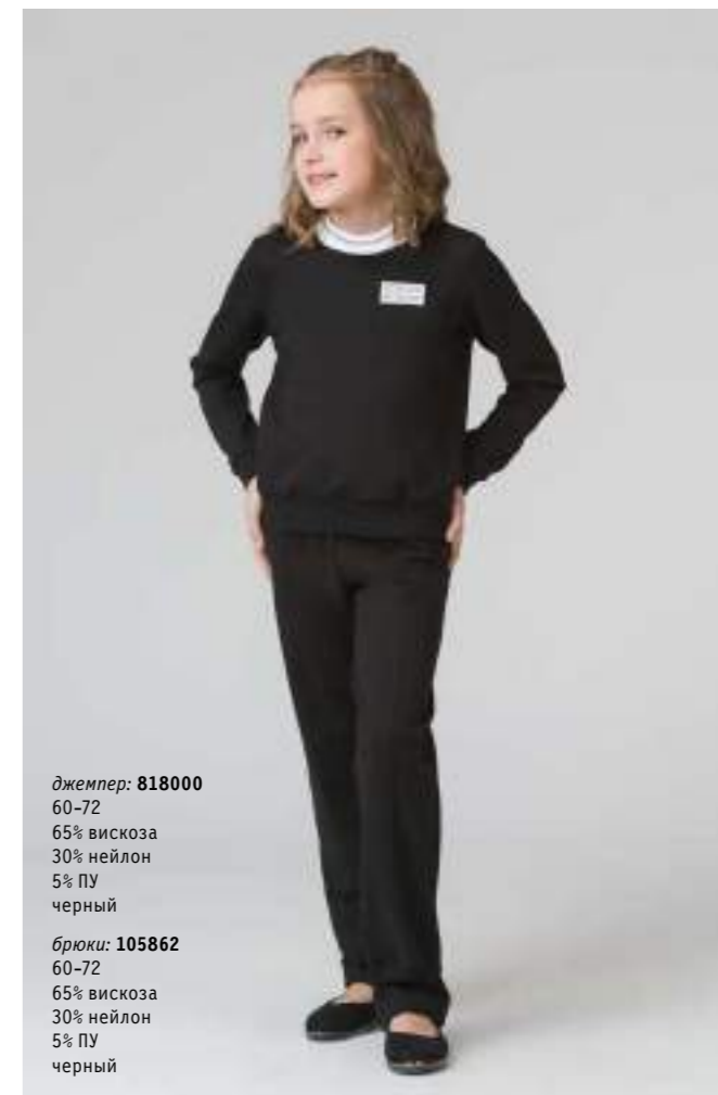
джерсер: 818000 60-72 65% вискоза 30% нейлон 5% ПУ черный брюки: 105862 60-72 65% вискоза 30% нейлон 5% ПУ черный