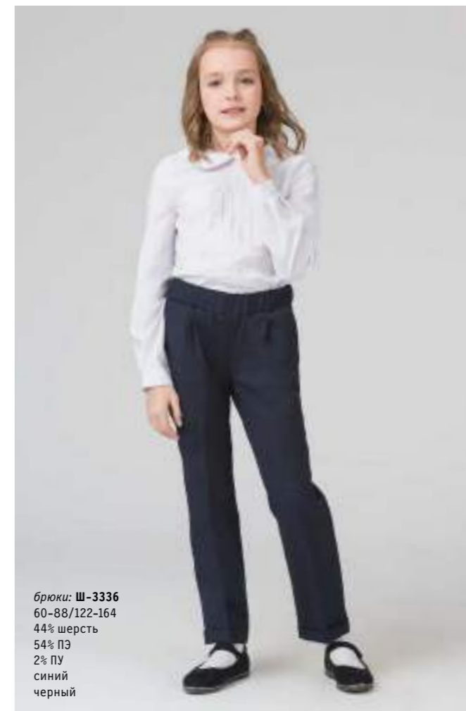
брюки: Ш-3336 60-88/122-164 44% шерсть 54% ПЭ 2% ПУ синий черный