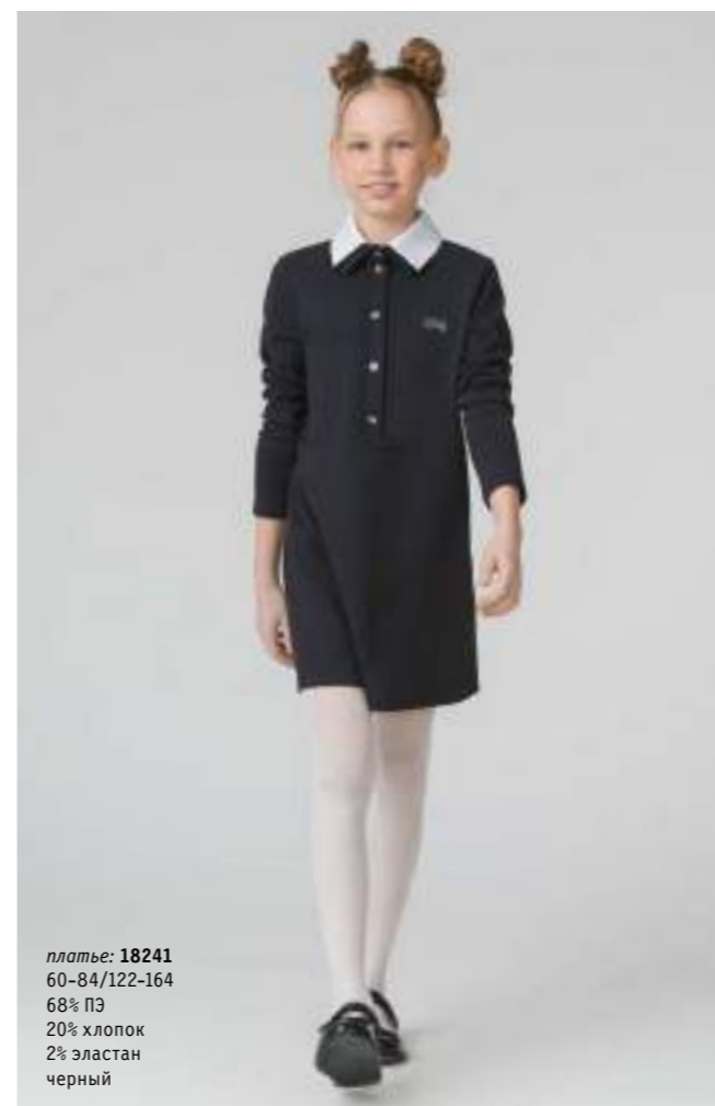
платье: 18241 60-84/122-164 68% ПЭ 20% хлопок 2% эластан черный