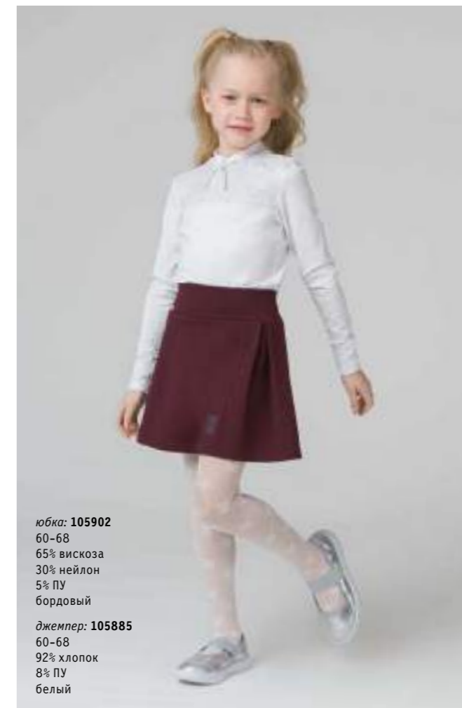
юбка: 105902 60-68 65% вискоза 30% нейлон 5% ПУ бордовый джерсер: 105885 60-68 92% хлопок 8% ПУ белый