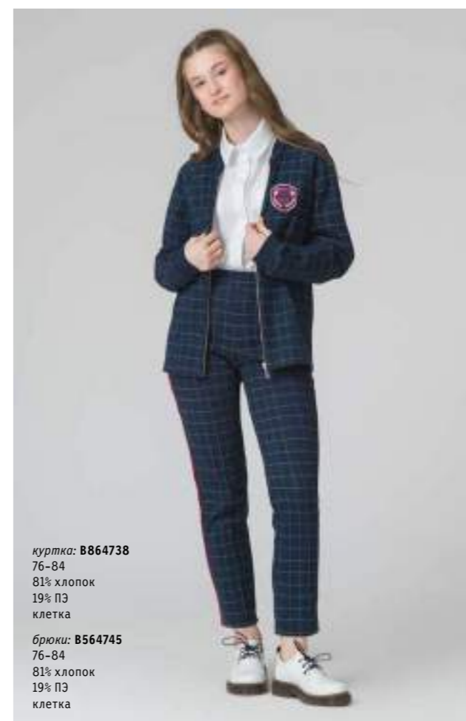
куртка: B864738 76-84 81% хлопок 19% ПЭ клетка