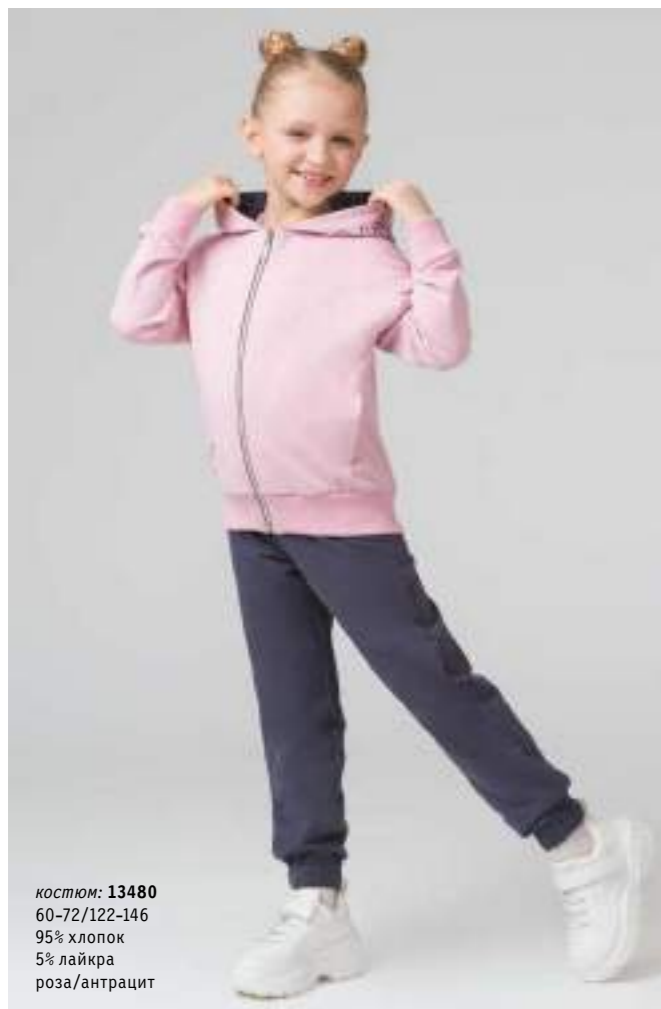
костюм: 13480 60-72/122-146 95% хлопок 5% лайкра роза/антрацит