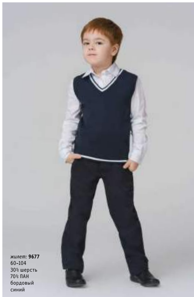
жилет: 9677 60-104 30% шерсть 70% ПАН бордовый синий