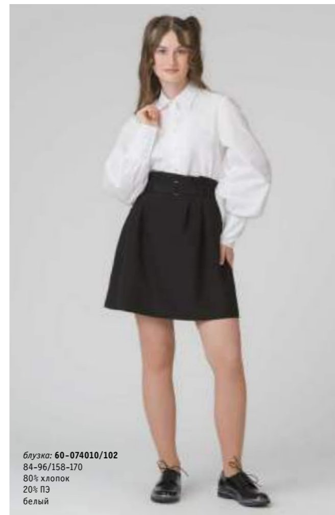
блузка: 60-074010/102 84-96/158-170 80% хлопок 20% ПЭ белый