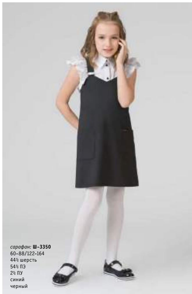
сарафан: Ш-3350 60-88/122-164 44% шерсть 54% ПЭ 2% ПУ синий черный