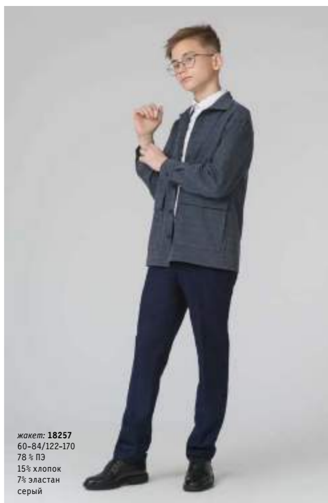
жакет: 18257 60-84/122-170 78% ПЭ 15% хлопок 7% эластан серый