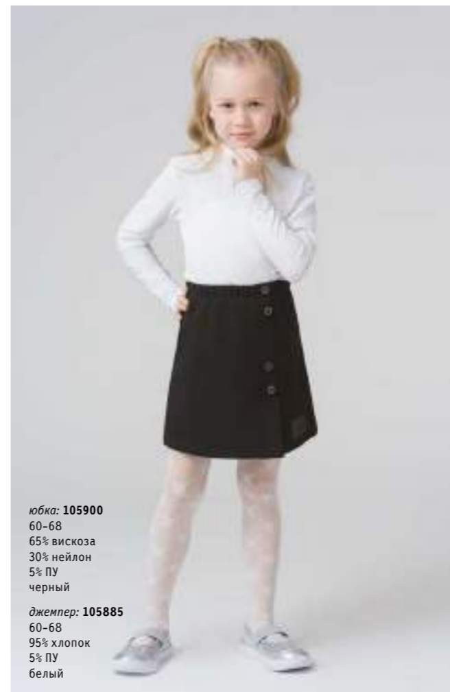
юбка: 105900 60-68 65% вискоза 30% нейлон 5% ПУ черный джерсер: 105885 60-68 95% хлопок 5% ПУ белый