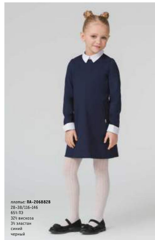
платье: ПА-206882В 28-38/116-146 65% ПЭ 32% вискоза 3% эластан синий черный

Коллекция выполнена из классической для школьной моды ткани на основе хлопка с добавлением полимерных волокон для повышения износостойкости и практичности.