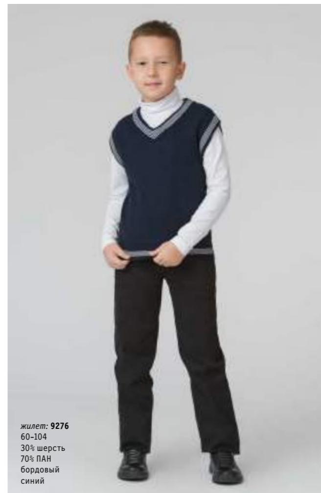
жилет: 9276 60-104 30% шерсть 70% ПАН бордовый синий