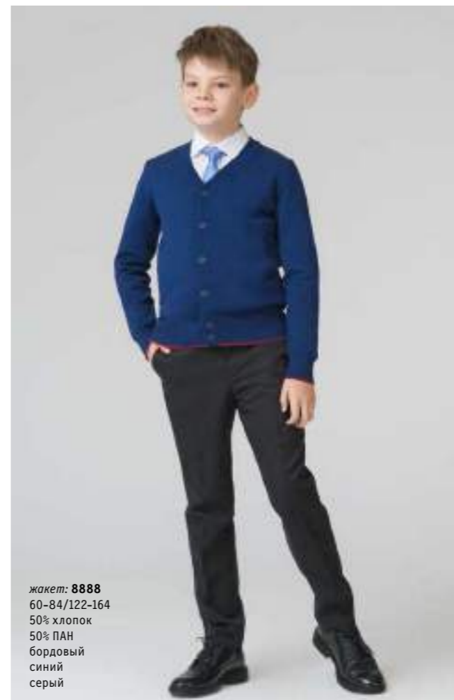
жакет: 8888 60-84/122-164 50% хлопок 50% ПАН бордовый синий серый