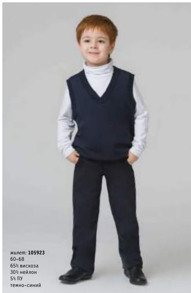
жилет: 105923 60-68 65% вискоза 30% нейлон 5% ПУ темно-синий