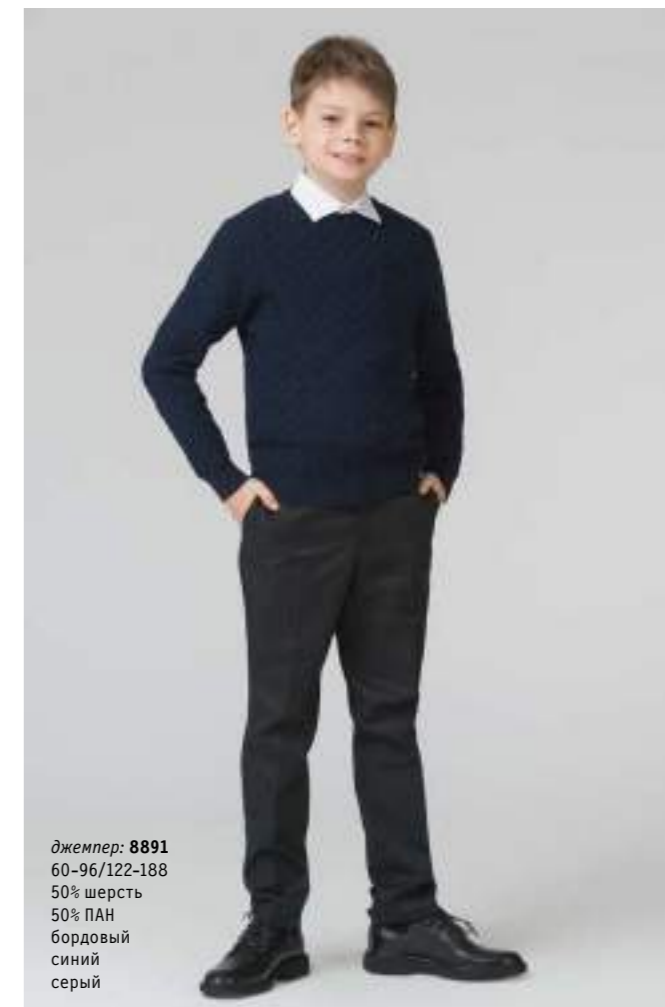
джерсер: 8891 60-96/122-188 50% шерсть 50% ПАН бордовый синий серый