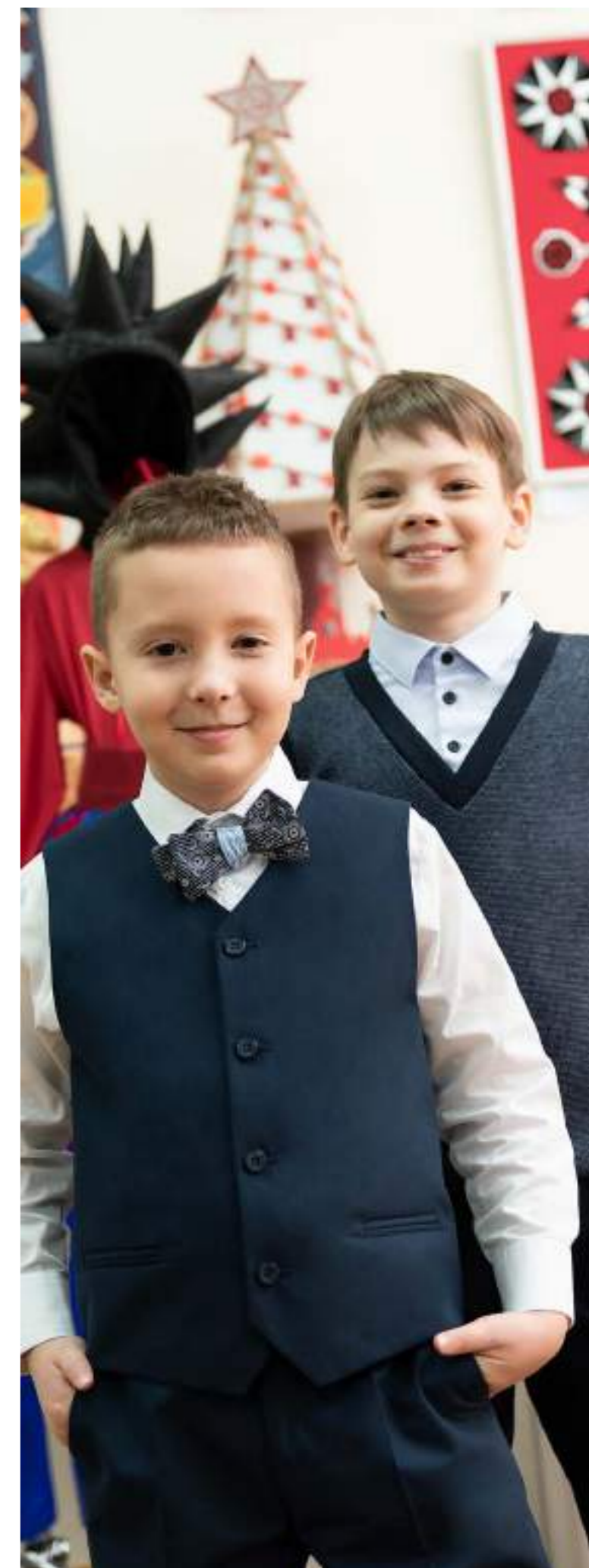
брюки: 20639-22/2 60-76/122-146 35% вискоза 63% ПЭ 2% лайкра синий