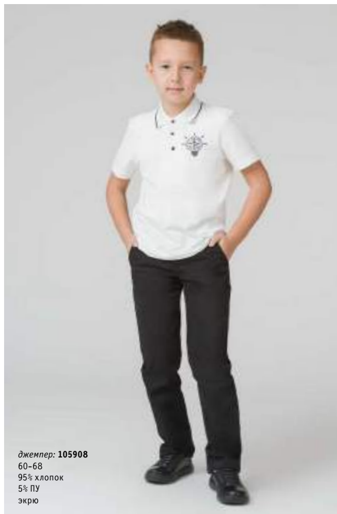
джерсер: 105908 60-68 95% хлопок 5% ПУ экрю