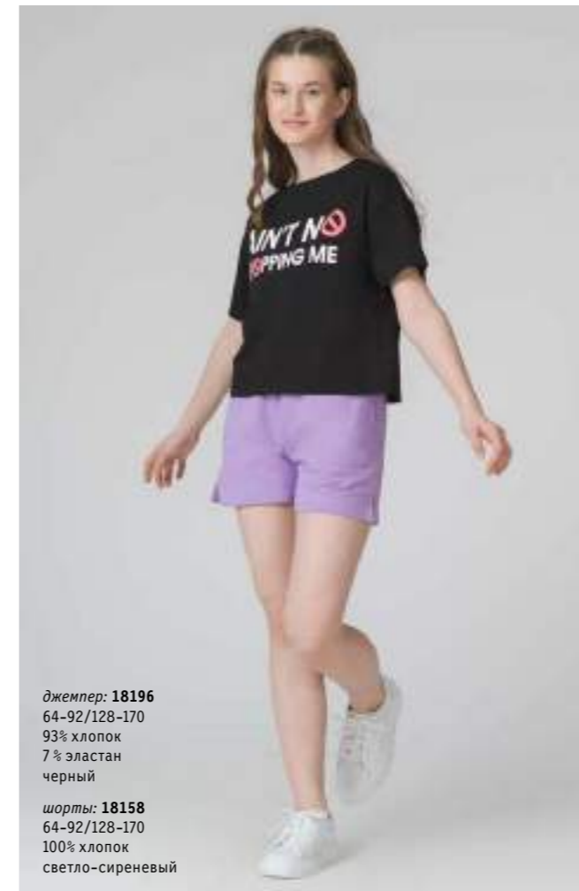
джерсер: 18196 64-92/128-170 93% хлопок 7% эластан черный шорты: 18158 64-92/128-170 100% хлопок светло-сиреневый