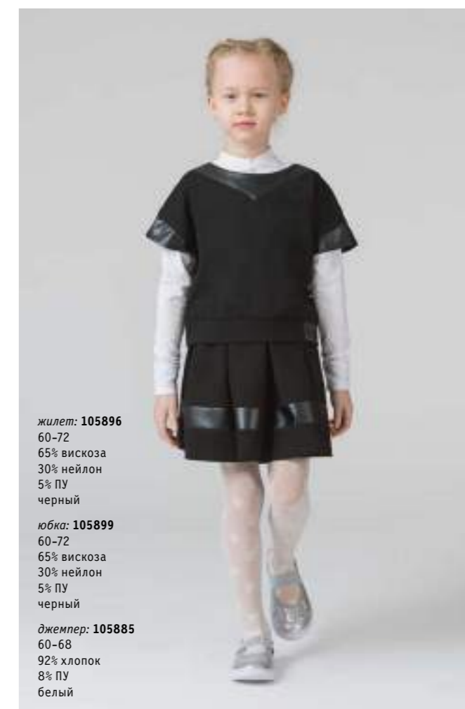
жилет: 105896 60-72 65% вискоза 30% нейлон 5% ПУ черный юбка: 105899 60-72 65% вискоза 30% нейлон 5% ПУ черный джемпер: 105885 60-68 92% хлопок 8% ПУ белый