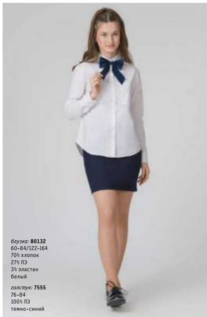
блузка: 80132 60-84/122-164 70% хлопок 27% ПЭ 3% эластан белый