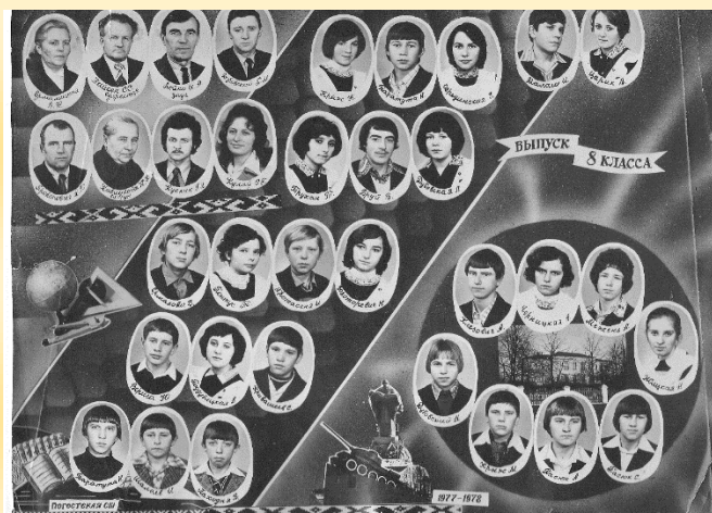
выпуск 1978 года