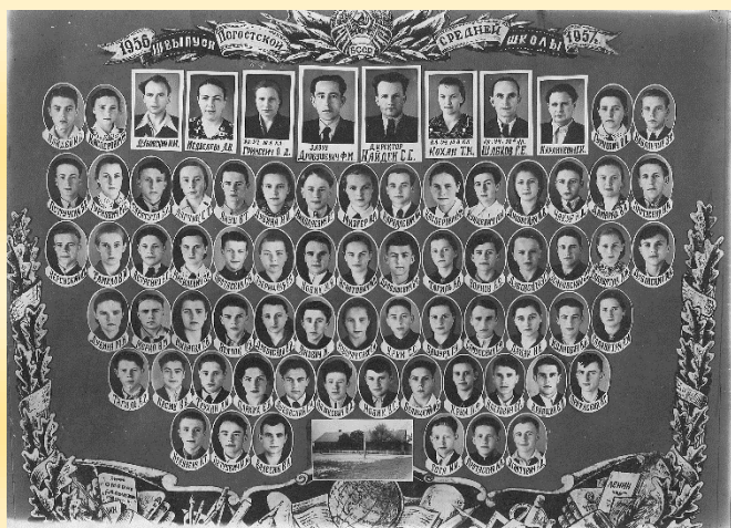
выпуск 1956 года