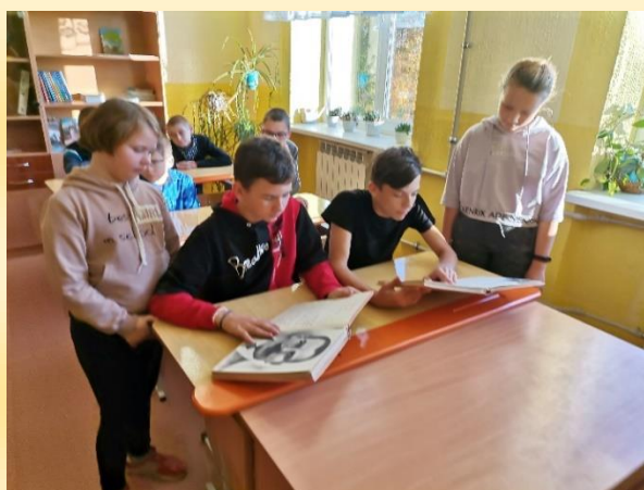
класная гадзіна “Найдзен Сцяпан Сямёнавіч – наш слаўны зямляк”

4. Практический. Ознакомление учащихся с результатами исследовательской деятельности. Классный час «Наиден Степан Семенович – наш славный соотечественник». Размещение материала на официальном сайте учебного заведения для демонстрации другим учебным заведениям (режим доступа).