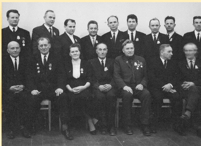
учителя Погостской школы